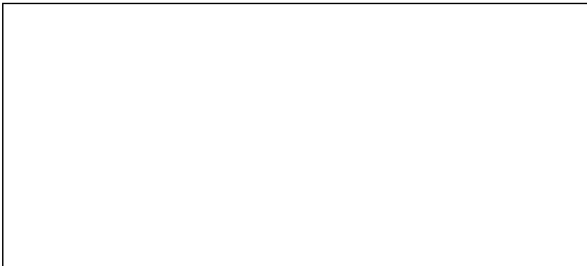
Peněžní tok Města v r. 1997 (kumulovaně)