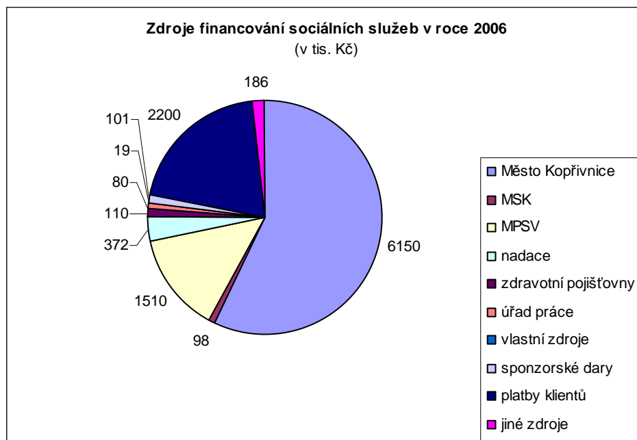
Graf č. 1

Je patrné členění příjmů poskytovatelů s ohledem na jejich právní formu. Zatímco Středisko sociálních služeb je zařízení zřízené městskou samosprávou, Domov Salus je neziskovou organizací a Charita je církevní právnickou osobou, Therápon 98, a.s. je podnikatelským subjektem. Organizace, ve snaze naplnit příjmovou stránku svého rozpočtu, hledají příjmy ze všech možných dostupných zdrojů včetně soukromých a nadačních.