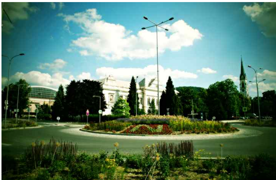
Okružní křižovatka na ulici Štramberské.