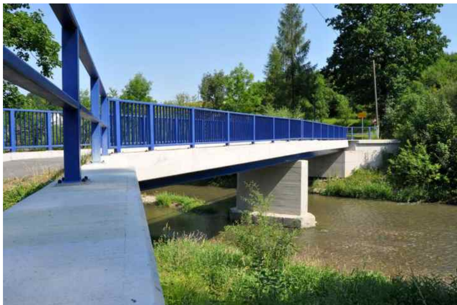
Zrekonstruovaný most Na Habeši.