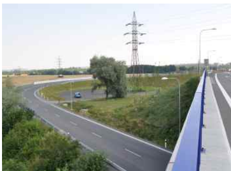
Nová sjezdová rampa.