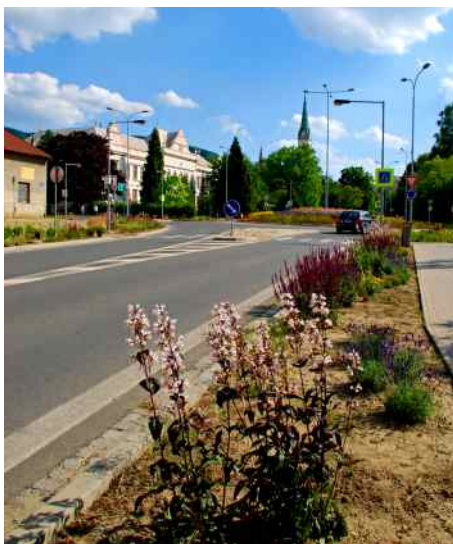
Ulice Štramberská před a po rekonstrukci.