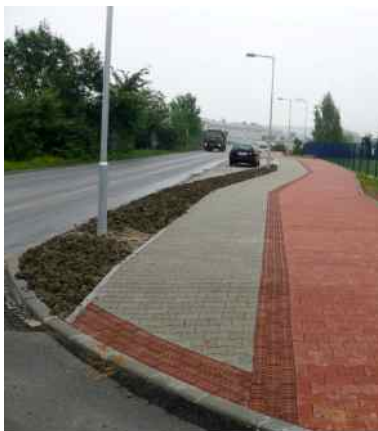
Ulice Panská před a po rekonstrukci.