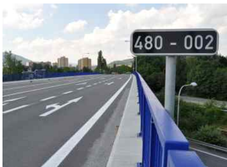
Zrekonstruovaný most přes železniční trať.