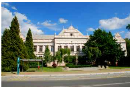
Ulice Štramberská po rekonstrukci.