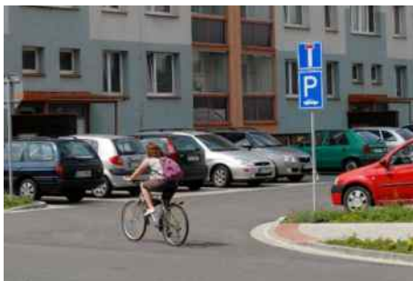
Parkovací stání na sídlišti Sever.