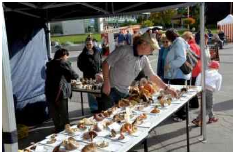
Farmářské trhy v centru města.

Město podporuje také drobné pěstitele a řemeslníky. Za účelem podpory lokální zemědělské produkce organizuje od roku 2012 farmářské trhy .