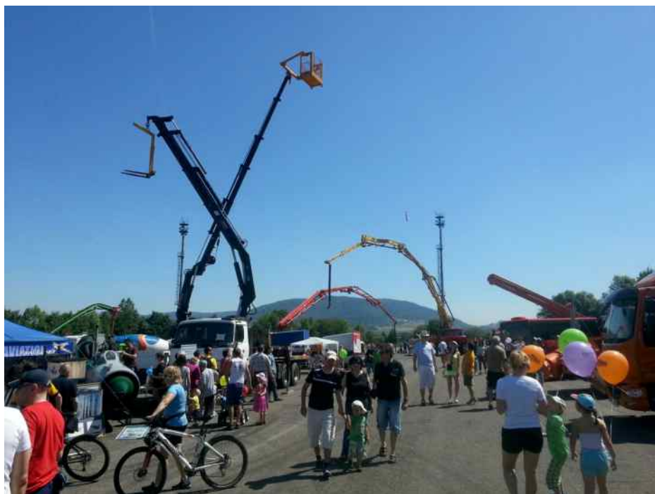
Kopřivnické dny techniky 2014.