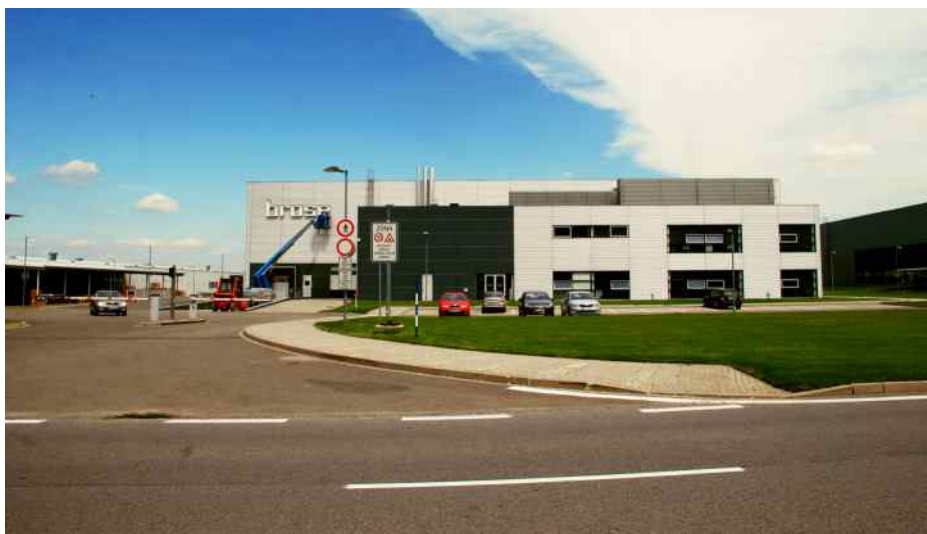
Společnost Brose CZ v průmyslovém parku.

Nejdynamičtěji se v současné době rozvíjí společnost Brose CZ. Ta působí v Kopřivnici od roku 2004 a kromě toho, že se s více než 2 tisíci pracovníků stala lídrem zaměstnanosti na Kopřivnicku, snaží se také všemožně zpříjemňovat život zdejších obyvatel. Rozvíjí sociální programy pro své zaměstnance, angažuje se při mnoha akcích pro děti a mládež, finančně se podílí na budování městské infrastruktury a podporuje společné projekty. V roce 2011 prodalo město společnosti Brose CZ pozemek v průmyslové zóně za účelem vzniku firemního školského zařízení pro děti předškolního a školního věku. Činnost Kids Clubu byla zahájena v červenci 2014.