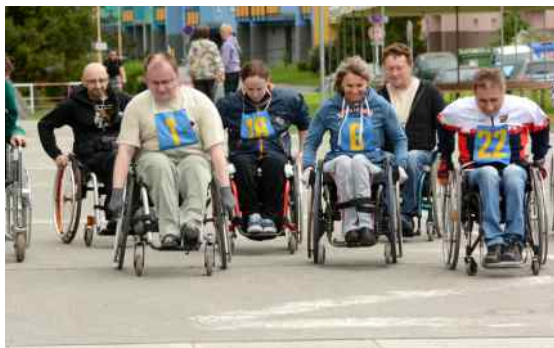
Sportovní hry zdravotně postižených dětí a dospělých.