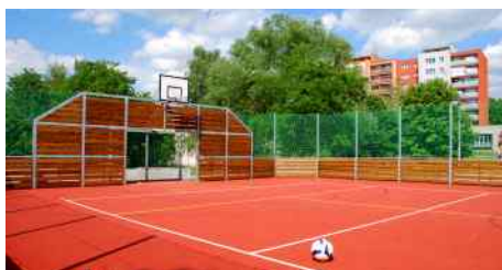
Víceúčelové hřiště na sídlišti Jih.