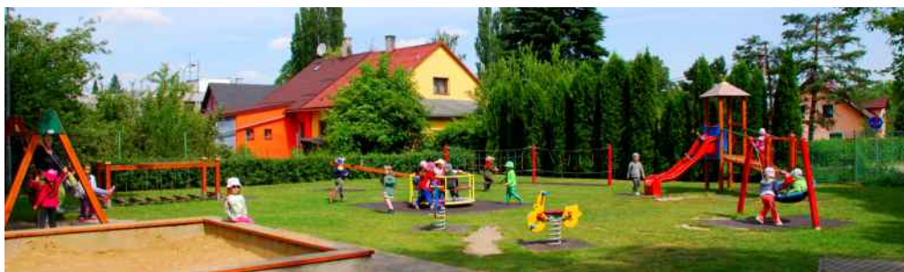
Dětské hřiště u ZŠ dr. Milady Horákové.

Zrekonstruována byla také táborová základna na Kletné provozovaná DDM Kopřivnice.