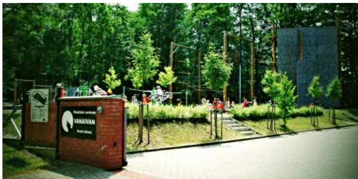
Skautské centrum Vanaivan.

V roce 2009 přispělo město částkou 1,6 mil. Kč na vybudování základny pro místní skauty. Ti následně v roce 2011 obohatili nabídku volnočasových a sportovních aktivit v Kopřivnici, když kolem skautského centra Vanaivan obnovili Areál zdraví. V něm se nyní nachází lanové centrum, lezecká stěna, venkovní fitness či přírodní amfiteátr.