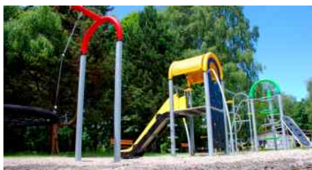
Dětské hřiště ve Vlčovicích.