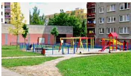
Dětské hřiště na sídlišti Sever.