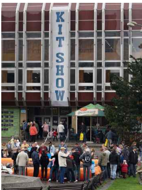
Beskyd Model Kit Show v KDK.