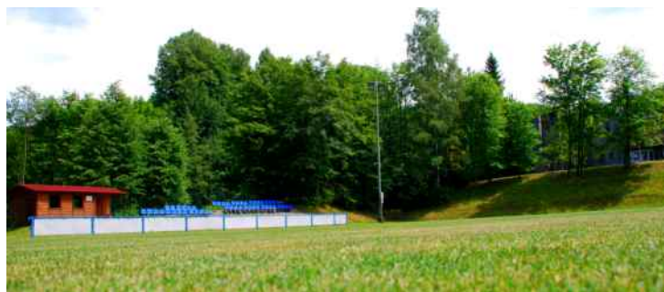
Bývalé škvárové hřiště.

V roce 2009 přispělo město částkou 1,6 mil. Kč na vybudování základny pro místní skauty. Ti následně v roce 2011 obohatili nabídku volnočasových a sportovních aktivit v Kopřivnici, když kolem skautského centra Vanaivan obnovili Areál zdraví. V něm se nyní nachází lanové centrum, lezecká stěna, venkovní fitness či přírodní amfiteátr.