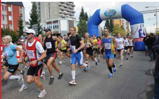
Běh rodným krajem Emila Zátopka.

V Kopřivnici působí řada sportovních klubů a kulturních spolků, na jejichž činnost město přispívá z účelových dotačních programů. Tyto kluby a spolky organizují mnoho akcí a jejich členové také úspěšně reprezentují město v různých regionálních, celostátních i mezinárodních soutěžích.