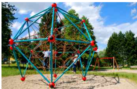
Dětské hřiště u Matesa.