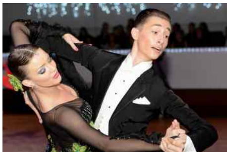
Taneční liga Tatra.