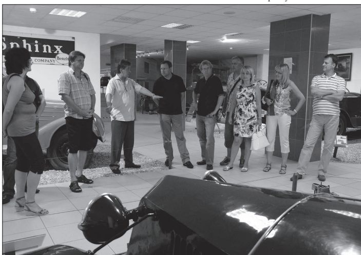
Delegace přednostů městských úřadů ze Slovenska si v rámci návštěvy Kopřivnice našla čas také na prohlídku Technického muzea Tatra.

„Je nutné tyto plány buď přehodnotit, a nebo jednat s vlastníky o tom, jestli to není společný zájem. Důležitý je také názor obyvatel, kteří by se k budoucnosti přehrady měli vyjádřit v rámci veřejných projednání,“ uzavřel Jalůvka.