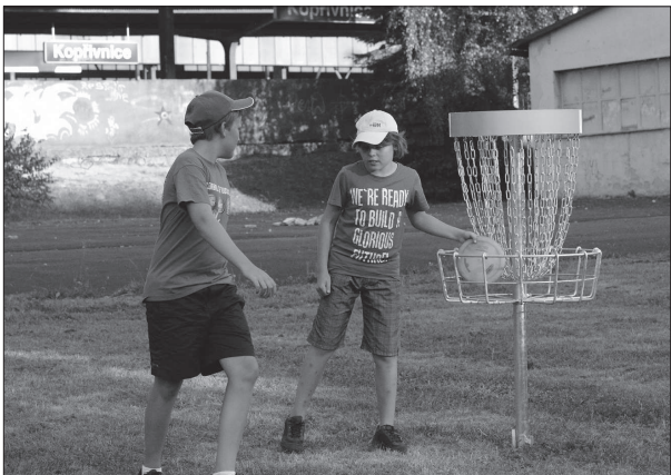
Discogolfový dýchánek pořádaný v rámci série akcí Teen-In vzbudil zatím největší zájem. Mladé Koprivničany čekají ještě dvě zábavná odpoledne.