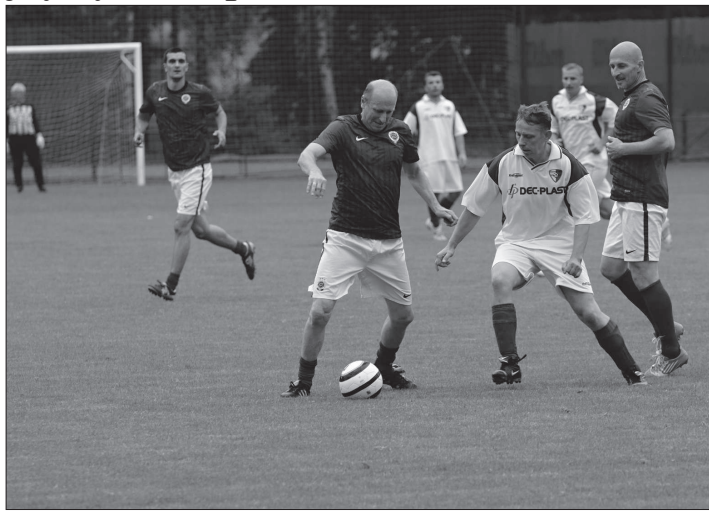
Vlčovický fotbal oslavil o prázdninách 80 let. V sobotu 13. července přilákalo pěkné počasí na tamní hřiště na 600 lidí, mezi nimiž byli i funkcionáři z fotbalového svazu. Na programu byly mimo jiné dva exhibiční zápasy. V zápase mužů podlehly Vlčovice MFK Frýdek-Místek 1:5 a v utkání starých gard porazili domácí vysloužilci se Spartou Praha 3:9.