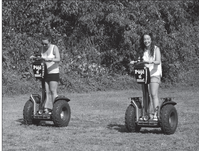
Vyzkoušet si trendová vozítka Segaway využilo v rámci série akcí Teen-In několik desítek mladých lidí. FOTO: DANA HOĐÁKOVÁ

Náklady na druhou etapu revitalizace veřejných prostranství přišly téměř na 28 milionů korun, přičemž 85 procent bude hrazeno z dotace a zbývajících 15 procent uhradí město ze svého rozpočtu. Vzhledem k tomu, že se díky soutěži podařilo městu ušetřit, mělo by v příštím roce podle vyjádření pracovníka odboru rozvoje města dojít na výměnu povrchů nebo celých úseků dalších vybraných částí chodníků v rozsahu zhruba 2 600 m 2 včetně silničních obrub a přídlažby kolem chodníků, které přiléhají k místní komunikaci. V rámci tohoto projektu dojde také k instalaci dalších kamerového bodu a k odvodnění podmacených prostor v blízkosti dětského hřiště U Matosa.