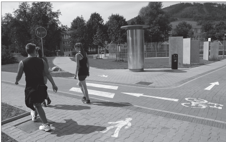
Úpravy veřejných prostranství na sídlišti Jih jsou téměř u konce. Sídliště dostalo nové chodníky, hřiště i další vybavení a za ušetřené peníze se ještě příští rok budou realizovat další úpravy chodníků.