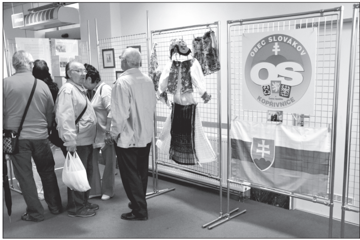
Výstava mapující dosavadní činnost krajanského spolku oslavila desáté výročí fungování Obce Slovákov v Kopřivnici.

Od 16 hodin budou v zasedací místnosti v 10. patře jednat o zrušení organizační složky Klubu Kamarád, o prodeji bytových domů Pod Bílou horou a nemovitosti č. p. 407 na ulici Sokolovské, o dotaci pro Tenisový klub Kopřivnice či o změně účelu dotace pro Klub házené Kopřivnice. Zastupitelé se budou zabývat i smlouvou o bezúplatném převodu pro parkoviště a chodník u Komerční banky.