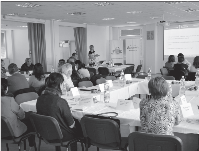
Před týdnem se sešli členové pracovních skupin v rámci komunitního plánování sociálních služeb a zvolily si své vedoucí.

Vykradenou chatku oznámil kopřivnickým policistům poškozený majitel. K přečinu porušování domovní svobody mělo dojít v období od 26. do 31. 8. v ulici Paseky. Doposud nezjištěný pachatel poškodil nejprve oplocení zahrady, následně násilím vnikl dovnitř chatky, kde odčizil přimočarou pilu Bosch a z přilehlé kůlny dvě plně přepravky piva v láhvi. Poškozenému majiteli tak způsobil 3,5tisícovou škodu. Na místě zanechal několik kriminalistických stop, které technik zajistil k další identifikaci možného pachatele.