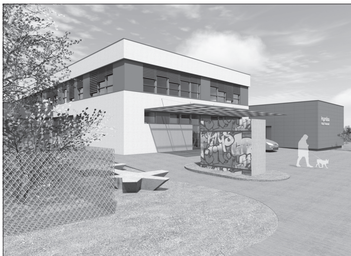
Vizualizace možné budoucí podoby komunitního centra, které by mělo vzniknout rekonstrukcí stávajících prostor Klubu Kamarád na sídlišti Sever.

Kopřivnice (dam) – Po červencovém mírném výkyvu směrem vzhůru v srpnu křivka mapující nezaměstnanost na Kopřivnicku mapující nezaměstnanost na Kopřivnicku znovu zaměřila směrem dolů, a to i přesto, že v celookresním měřítku situace na trhu práce stagnuje. Po oba prázdninové měsíce dosahovala nezaměstnanost v okrese Nový Jičín hodnoty 4,43 %. V Kopřivnici bylo v červenci bez práce 4,62 % lidí, na konci srpna 4,58 %. Rozdíl je to nepatrný, v absolutních číslech ubylo v evidenci během srpna dvanáct osob. Celkem bylo posledního srpna na Kopřivnicku evidováno 1 333 lidí bez práce. Navíc je zde předpoklad dalšího zlepšování situace, hlad firem po pracovních neúspěších a v evidenci úřadu práce přibýlo během srpna další 70 míst. Jen v Kopřivnici a nejbližším okolí může úřad práce nabídnout uchazečům 660 volných pracovních míst. Na jednu volnou pracovní pozici tak aktuálně připadají dva uchazeči v evidenci úřadu práce.