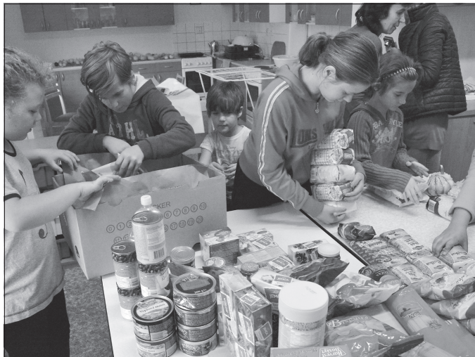
Žáci ZŠ Floriána Bayera balí potraviny, kterými přispěli do letošního ročníku potravinové sbírky. Podobným způsobem pomáhají už třetím rokem.