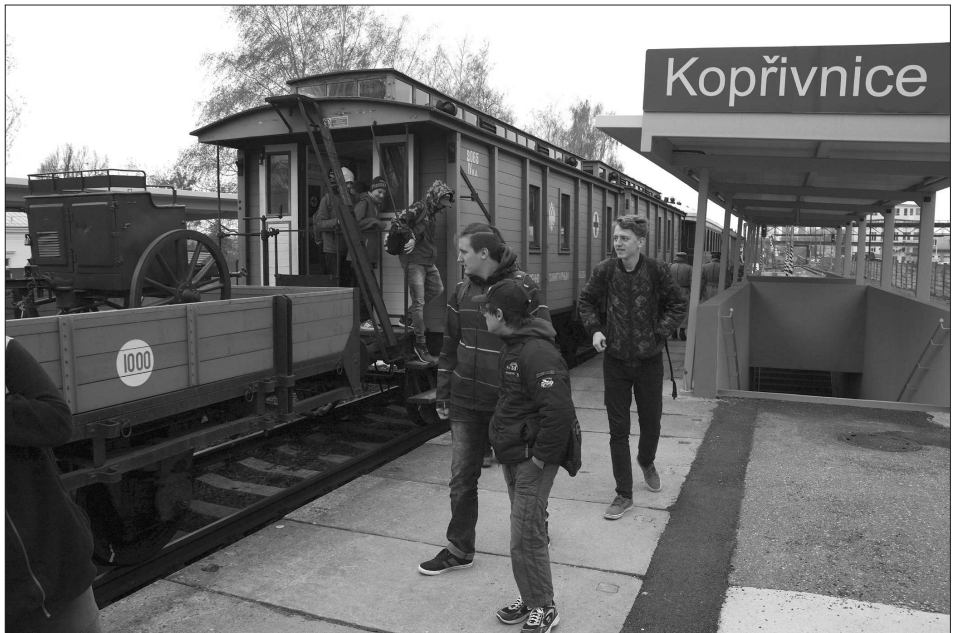
Během šesti dnů prošly expozici Legiovlaku asi čtyři a půl tisíce lidí. Posádka unikátního muzea na kolejích nabídla lidem informace o historii československých legií.