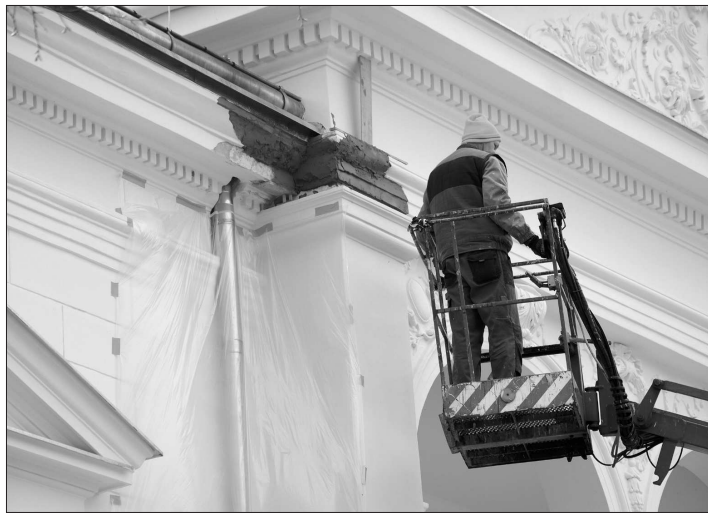
Poškozená fasáda Ringhofferovy vily se v minulém týdnu dočkala první opravy. Radnice stále čeká na nezávislý posudek vloni provedené rekonstrukce.