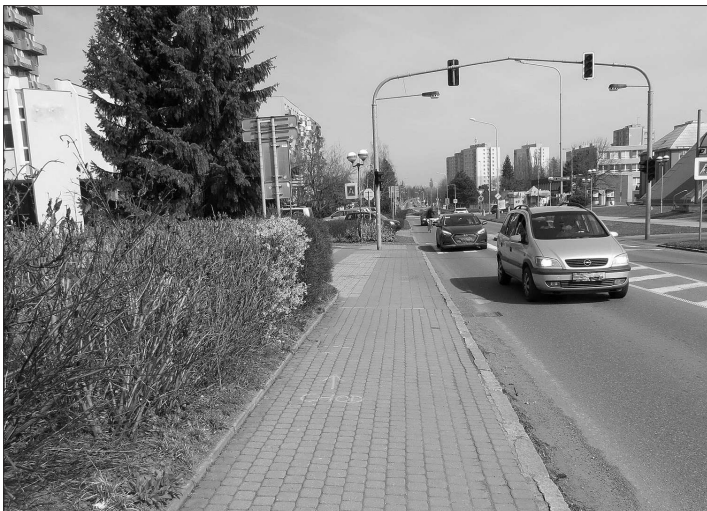
Policie hledá svědky nehody, při níž na tomto místě cyklista srazil chodkyni, která utrpěla vážné zranění.

„V rámci pochůzky bylo zjištěno 51 osob, které pospávají venku na různých místech ve městě včetně noclehárny. V rozhodnou noc z 13. na 14. dubna spalo v azylovém domě 19 osob a v ubytovně 47 lidí.“ upřesnila výsledky Pavla Zrunková, pracovnice sociálního odboru, která byla koordinátorkou sčítání za radnici. Zjištěná data o osobách bez domova budou sloužit ministerstvu pro zpracování Koncepce prevence a řešení problematiky bezdomovectví v ČR. Data získá také radnice, která s nimi bude pracovat například v rámci komunitního plánování sociálních služeb.