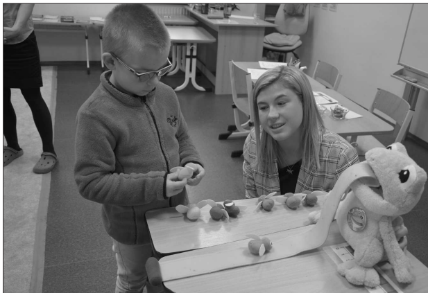
Před týdnem přišlo k zápisům do prvních tříd 308 dětí, část z nich přišla opakovaně, protože vloni rodiče požádali o odklad nástupu do školy.