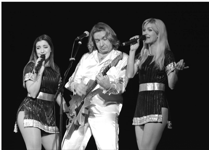
Revivalová kapela Abba Stars vystoupila v kopřivnickém kulturním domě na benefičním koncertě, jehož výtěžek popouje na konto ZŠ a MŠ Motýlek.