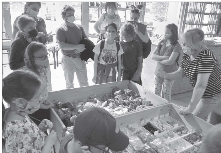
Děti navštěvující badatelský kroužek BADY vyrazily na výlet do Rožnova, kde si rozšířily své znalosti z geologie.

Kopřivnice (dam) – Růst nezaměstnanosti pokračuje i na Kopřivnicku, zatím je však poměrně pozvolný. Během měsíce května přibývalo v evidenci uchazečů o zaměstnání 51 lidí. Celkem jich zdejší pobočka eviduje 1 167, což znamená, že podíl nezaměstnaných se zvýšil na 4,22 %. Od prudkého zbrzdění ekonomiky v březnu letošního roku na Kopřivnicku přibývaly přes dvě stovky nezaměstnaných a ještě razantněji se propadl počet nabízených volných pracovních pozic. Zatímco ještě na konci února zaměstnavatelé nabízeli 1 103 míst, na konci května jich bylo už jen 524, tedy o polovinu méně než před čtvrt rokem. Podle ekonomických odborníků se navíc situace na trhu práce bude i nadále zhoršovat. Kopřivnici nenahrává ani skutečnost, že průmysl a především ten automobilový byl, zdá se, postižen ještě víc, než se očekávalo. Oblast Kopřivnicka má tak v rámci okresu nejvyšší nezaměstnanost, ale zároveň zde úřad práce nabízí i největší počet volných pracovních míst, přestože jejich množství vytrvale klesá.