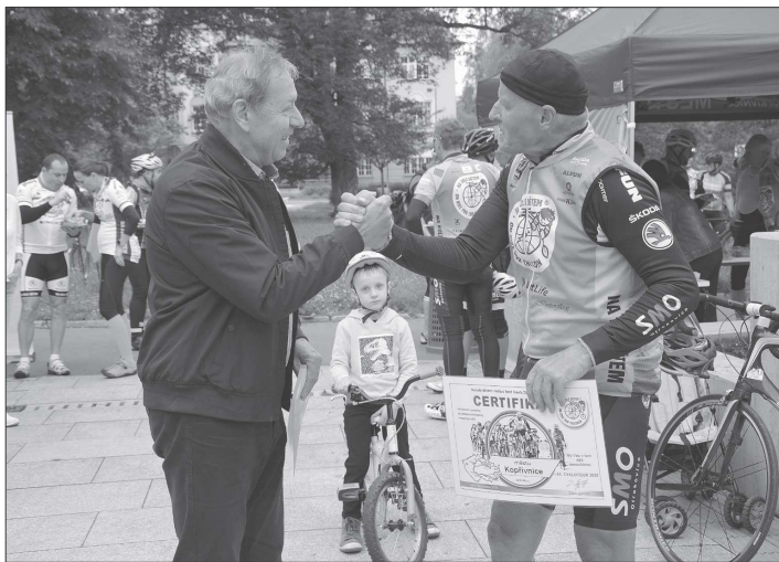
Město Kopřivnice přispělo na konto projektu Na kole dětem symbolickou částkou pět tisíc korun.

nice, odkud se stácela na jih s cílem ve Slopném nedaleko Vizovic, a měřila již přes 100 km. Do cílového města Lanškrouna dorazí tour v sobotu 20. června.