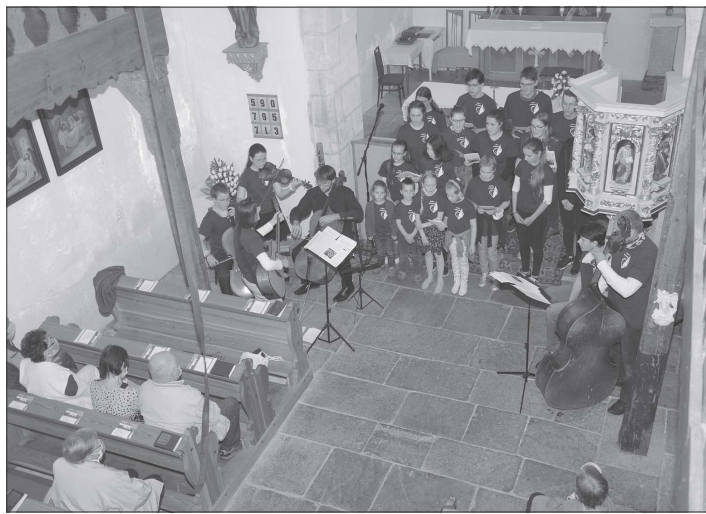
Součástí programu Noci kostelů u sv. Kateřiny bylo i vystoupení dětské scholy ze Štamberka.