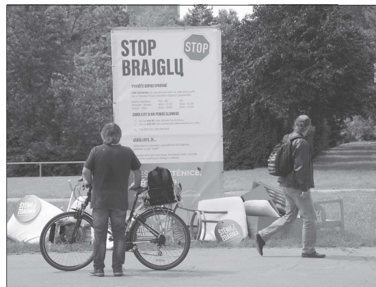
Černá skládka uprostřed města má Kopřivničany upozornit, jak řešit odkládání objemného odpadu.