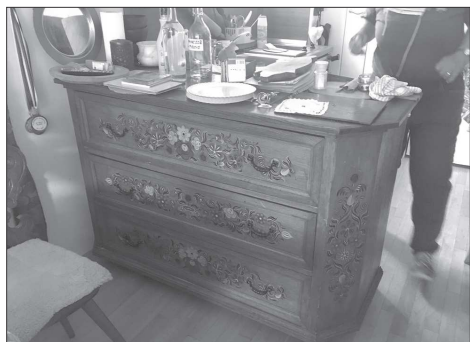
Malovaný prádelník z bytu D. Zátokové.

Začátek je plánován na 18. hodinu, první koncert by měl začít okolo devatenácté hodiny.