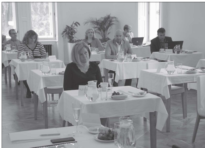
Zástupci měst sdružených v Benchmarkingové iniciativě 2005 jednají v závěru minulého týdne v prostorách Ringhofferovy vily i zdejší radnice.

Vzhledem k omezením nastaveným kvůli šíření koronaviru bylo kopřivnické setkání z minulého týdne vůbec první takovou akci Benchmarkingové iniciativy v letošním roce. Covid-19 se tak logicky promítl i do programu pracovního jednání. Zástupci jednotlivých měst diskutovali o tom, jak koronavirová krize ovlivnila fungování úřadů, nebo třeba o důsledcích epidemie na personální řízení v souvislosti s prací na dálku nebo třeba i dopadem snížení rozpočtových příjmů na odměňování zaměstnanců.