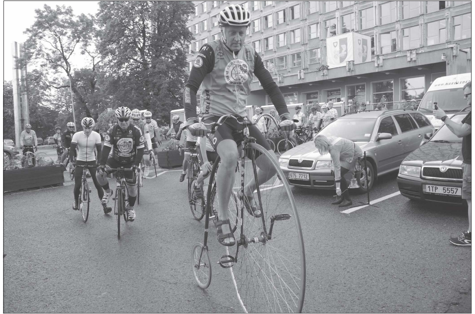
Druhá etapa letošního charitativního cyklotour Na kole dětem startovala minulý pátek před budovou radnice. Kopřivnice byla cílovým městem prvního dne 11. ročníku akce vytvořené cyklistou Josefem Zimovčákem.

Cyklotour Na kole dětem je sportovní projekt Josefa Zimovčáka na podporu onkologicky nemocných dětí a mezi jeho aktivními účastníky nechybí významné osobnosti, úspěšní sportovci a známé tváře. (Pokračování na straně 7)