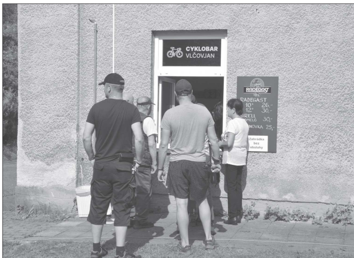
Spolek Vlčojan otevřel ve svém objektu cyklobar, který bude v provozu od pátku do neděle a jehož výtěžek bude použit na opravy budovy a spolkovou činnost.

V pondělí budou otevřeny zahrady v Mateřské škole Lubín, v Kopřivnici MŠ Francouzská a Pionýrská. V úterý budou zpřístupněny zahrady MŠ Jefabinka (ul. Z. Buriana) a MŠ Krátká. Ve středu si rodiče budou moci vybírat, zda půjdou do MŠ Pionýrské, I. Šustaly či do Mniší. Ve čtvrtek budou zpřístupněny zahrady MŠ Krátké a Francouzské a v pátek to budou zahrady MŠ I. Šustaly a Jefabinky. Zahrady budou otevřeny pouze za příznivého počasí, které nebrání bezpečnému pobytu a využití herních prvků. V době provozu pro veřejnost je vstup do zahrad umožněn dětem do sedmi let věku v doprovodu dospělé osoby. Ve dnech státních svátků budou zahrady pro veřejnost uzavřeny. Harmonogram s provozní dobou je zveřejněn na webových stránkách Mateřských škol Kopřivnice.