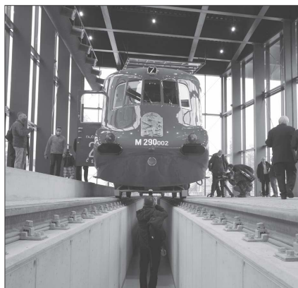
Nový depozitář umožní návštěvníkům prohlédnout si železniční unikát ze všech stran, dostanou se i pod podvozek.