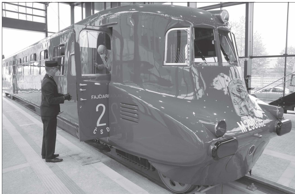
Renovovaný a plně provozuschopný železniční vůz M290.002 známější jako Slovenská strela je už týden zpět v Kopřivnici. Lidé vlak mohou zatím obdivovat pouze přes sklo výstavního depozitáře.