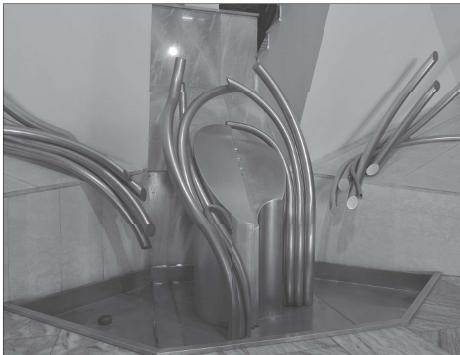
Kašna ve vestibulu kulturního domu je dílem místního sochaře a designéra Jiřího Španihela.