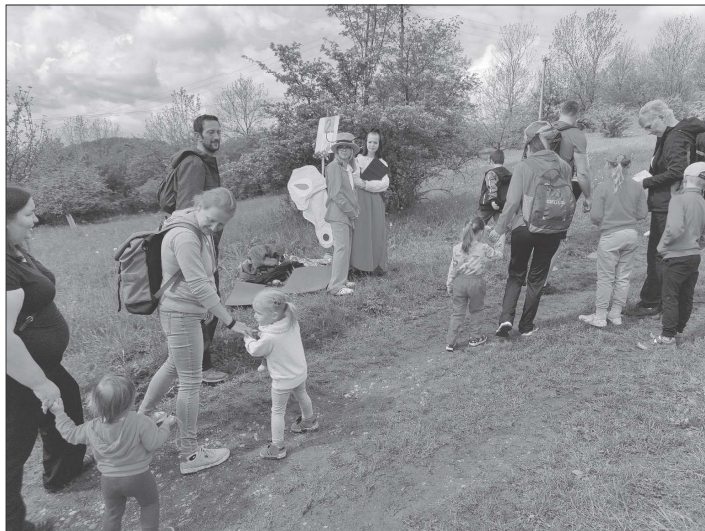
Značnou zájmu se v sobotu těšil Pohádkový les, který společně připravují Kopřivnice a Štramberk. Zhruba čtyřkilometrová trasa vedla přes katastrofy obou měst.

Vloni nastavená covidová opatření změnila u mnohých živnostníků způsob vyřizování jejich záležitostí. V březnu, kdy z důvodu lockdownu omezovaly všechny úřady hodiny pro styk s veřejností, se komunikace přesunula do on-line prostoru. „S živnostníky jsme komunikovali převážně telefonicky a prostřednictvím e-mailu. Potřebné tiskopisy jsme podnikatelům zaslali elektronicky a oni nám zpět posílali vyplněné a podepsané dokumenty buď poštou, nebo do schránky u vchodu do úřadu. Podnikatelé si také ve větší míře začali zřizovat datové schránky, čímž se zvýšilo množství elektronické komunikace,“ dodala vedoucí obecního živnostenského úřadu.