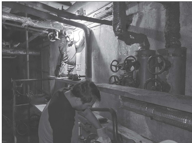
V rámci odstávky zdejší teplárny společností Komterm došlo k plánovaným opravám technologií horkovodu i elektrické rozvodny.