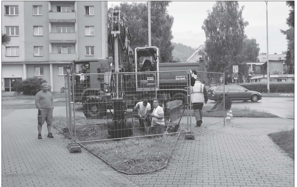
Zahájení prací na přeložkách inženýrských sítí v okolí křižovatky ulic Obránců míru, Francouzské a Školní zatím dopravu příliš neomezuje. V září, kdy se předpokládá start stavebních prací na křižovatce samotné, se už ale dají předpokládat výraznější omezení příjezdu frekventovaným směrem.

budování hřiště počítáno s částkou 5 milionů korun včetně DPH. Nám se podařilo vysoce snížit náklady s cenou ve výši 3,3 milionu korun včetně DPH,“ konstatoval místostarosta Krompolec. V rámci výstavby hřiště bude z preventivních důvodů vybudován odvodňovací systém. Aby hřiště mohlo být používáno delší dobu, bude mít rovněž umělé osvětlení. Firma dále zpevní přístupové plochy, instaluje mobiliář včetně sportovního vybavení a záchytného oplocení, provede terénní úpravy a lajnování. „Od předání stavebního hřiště musí společnost vybudovat hřiště do 60 kalendářních dnů, v závislosti na klimatických podmínkách však nejpozději do konce října,“ dodal místostarosta Krompolec.