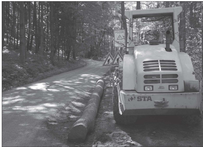
V minulém týdnu byla ukončena oprava zhruba kilometrové cesty od koupaliště na Janíkovo sedlo. Vzhledem k použité technologii by si na ni cyklisté měli dávat pozor.

Provoz na silnici bude po opravách obnoven, ale ještě minimálně několik týdnů by měli být uživatelé komunikace obezřetní. Povrch silnice může být do vyzrání povrchu v některých místech kluzký. Především v zatáčkách pak cyklistům hrozí, že na kamenném posypu dostanou smyk, a je zde zvýšené riziko nepříjemných pádů.