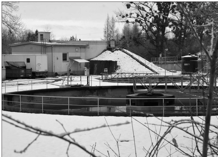
V letošním roce byla dokončena dosazovací nádrž, která má zvýšit kapacitu kopřivnické čističky odpadních vod před napojením dalších místních částí.