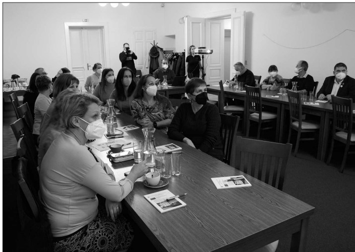
Na minikonferenci pořádané ZŠ Alšova se její pedagogové dělili o své zkušenosti z fungování projektů v rámci programu Erasmus+.