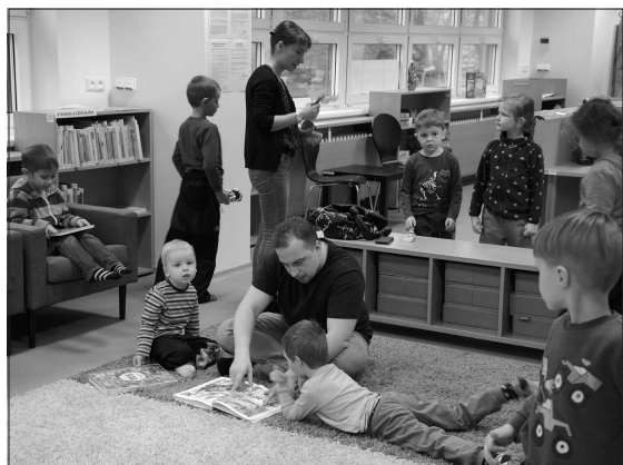
Děti z MŠ Polárka si užívají setkání se Čtyřlístkem na půdě kopřivnické městské knihovny.

Kopřivnice (dam) – I na půdě kopřivnické knihovny se poslední listopadový pátek slavil Den pro dětskou knihu. Cílem celorepublikové akce je především podpořit dětské čtenářství, propagovat knihy pro malé čtenáře a prezentovat knihovny. Letošním ročníkem Dne pro dětskou knihu provedl všechny účastníky legendární Čtyřlístek. Myšpulín, Fifinka, Bobik a Pind'a jsou u dětských čtenářů populární už více než půl století a jejich příběhy byly často prvním čtením pro celé generace Čechů. Aktivitu připravené pro nejmenší čtenáře se letos uskutečnily na půdě pobooky městské knihovny v Komunitním centru Pětka na Severu. (Pokračování na str. 4)