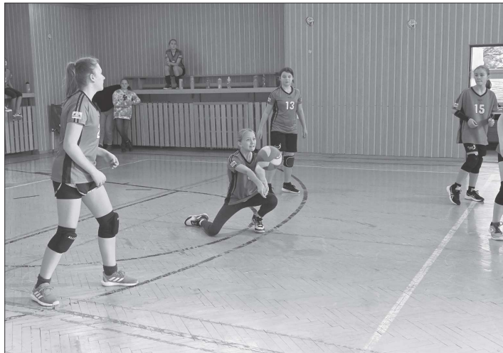
Mladší žákyně KV Kopřivnice doma porazily SVK Nový Jičín B, ale prohrály s Raškovicemi, a v dalším turnaji budou hrát opět ve skupině C.

Mladší žákyně měly na programu druhý turnaj MS přeboru sk. C. Družstvo Frenštátu kvůli karanténě nedorazilo, a tak zbyla trojice týmů. Kopřivnice s Raškovicemi prohrála ve dvou vyrovnaných setech, nad SVK Nový Jičín B však slavila vítězství 2:1. Ve skupině obsadila nakonec druhé místo a do skupiny B postupily Raškovicemi. Starší žákyně hrály druhý turnaj MS přeboru sk. B. Již v půlce listopadu, vyhrály 2:1 na sety nad Blůvcem i Raškovicemi, ale kvůli covidu v družstvu Orlové se tento zápas dohrával ve