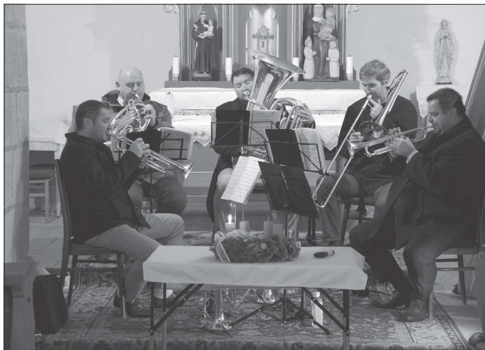
Koncert žesťového kvintetu All Brass Band si lidé v neděli mohli užít buď přímo v kostele sv. Kateřiny, nebo on-line na Facebooku.

Štramberk (dam) – S nabídkou nasát vánoční atmosféru při procházce Štramberkem za betlémy přichází sousední město už druhé svátky za sebou. Nápad, který vloni nahradil tradiční výstavu betlémů, se setkal s velmi pozitivním ohlasem, a tak i letos organizátoři využijí stejný model. Lidé už od věčerejška mají možnost nahlédnout do oken domů a výkladních skříní obchodů a obdivovat v nich vystavené betlémy. Letos je připraveno hned 34 zastavení. Ti, kdo Štramberkem za betlémy vyrazí, potěší nejen své oko, ale udělají i něco pro své zdraví. Trasa totiž začíná u kapličky v Národním sadu a končí až v kostele sv. Kateřiny v zaniklých Tamovicích. Lidé ale samozřejmě nemusí trasu absolvovat celou a mohou si vybrat jen její část, nebo si procházku rozdělit do několika částí. Času na to budou mít dost, protože betlémy budou na svých místech dva měsíce, od letošního 1. prosince do 2. února příštího roku. K vidění budou betlémy různého stáří, velikosti a vyrobené z nejrůznějších materiálů. Novinky budou i komentované prohlídky, které jsou připraveny hned ve třech termínech. První je naplánována už na pátek 3. prosince a začíná v 16 hodin u stanoviště č. 1 v kapličce v Národním sadu. S průvodcem si pak lidé mohou trasu projít ještě dva následující pátky 10. a 17. prosince.