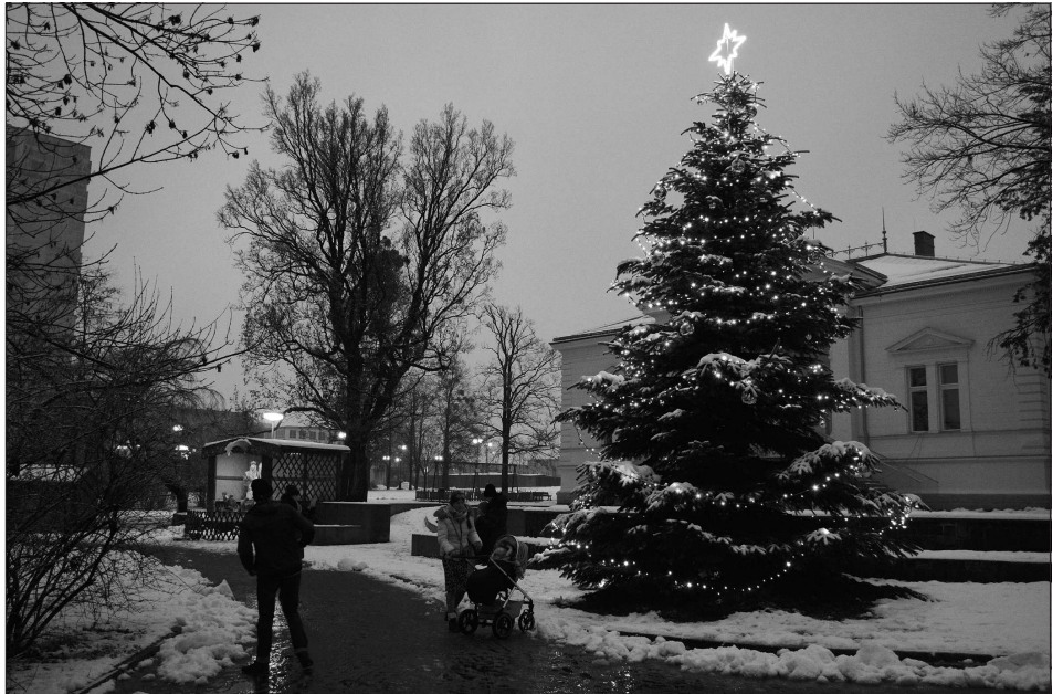
Vánoční strom před Ringhofferovou vilou se poprvé rozzářil v neděli 28. listopadu devět minut před 16. hodinou. Událost sledovalo jen několik lidí. Původně plánovaný program zahájení adventu byl zrušen.