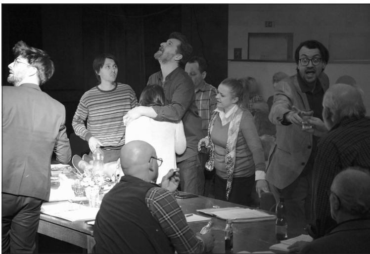
Přímou na ploše velkého sálu kulturního domu zasedalo Společenstvo vlastníků v podání členů souboru pražského Divadla Vostoj.