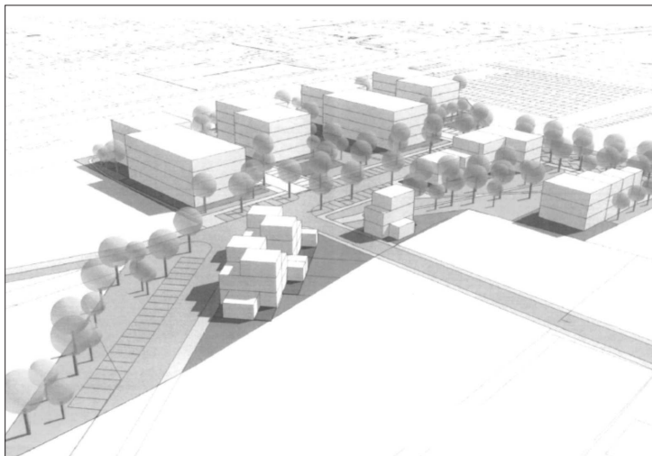
Objemová studie možné budoucí zástavby, kterou pro lokalitu Kopřivnice – Západ připravuje developerská společnost Eden Rožnov, s. r. o.