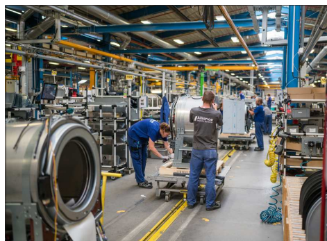
Výrobní operace na montážní lince praček.

nance příjemné, moderní, a hlavně bezpečné pracovní prostředí. Drtivá většina našich zaměstnanců zná pračky, sušičky nebo žehliče doslova do posledního šroubku – ať už se jedná o kolegy ve STAR, kteří je navrhují a vyvíjejí nebo kolegy ve výrobě, kterým naše výrobky projdou pod rukama. Ale v našem týmu jsou také například IT odborníci, pracovníci servisů, logistiky nebo marketingu a prodeje. Letošní rok stále ještě nabádá k opatrnosti, ale jsem moc rád, že se nám naše letošní výročí podařilo společně oslavit a přejí nám všem hodně dalších úspě-