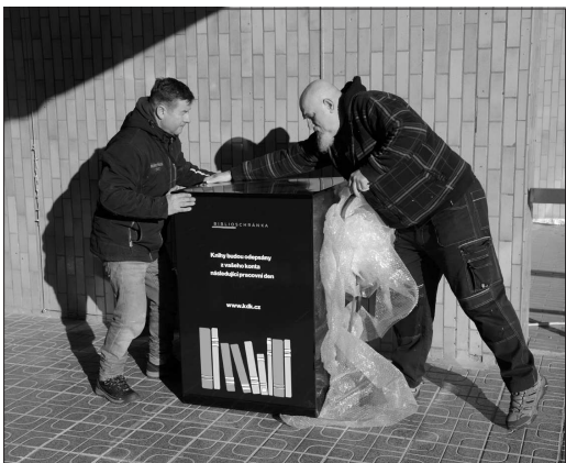
Na konci minulého týdne byla nová biblioschránka instalována u vstupu do KDK. Teď už slouží čtenářům.