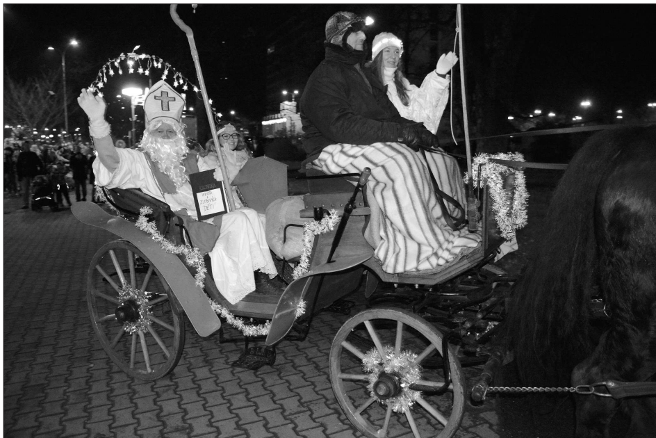
Většina na víkend naplánovaných akcí byla v Kopřivnici zrušena, ale Mikulášskou jízdu městem si v neděli v podvečer nenechaly ujít stovky obyvatel města.