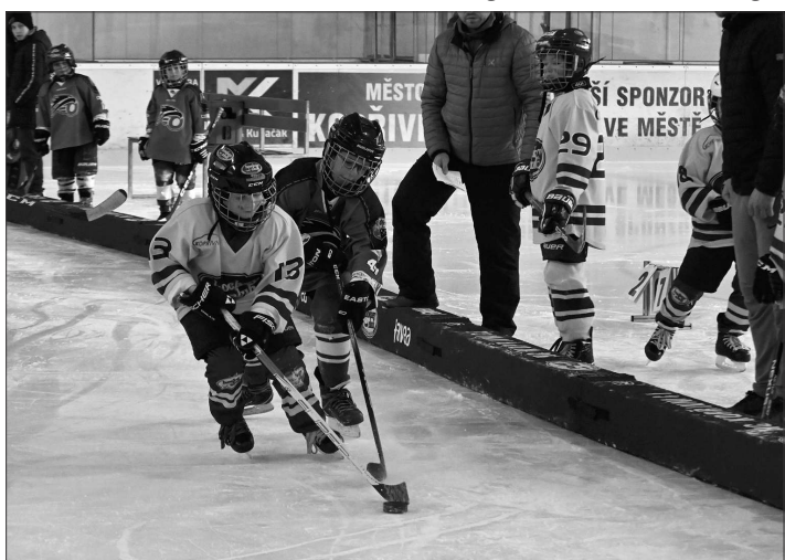
Malí hokejisté HC Kopřivnice získali na domácím turnaji v konkurenci dalších čtyř týmů Moravskoslezského kraje zlato a stříbro.

Výsledky kopřivnických družstev v turnaji o pohár města Kopřivnice v minihokeji (4. 12.): skupina A: HC Kopřivnice – HC RT TORAX Poruba 1:3, 1:4 a 5:0; – HC Oceláři Třinec 5:2, 3:0 a 2:1; – HC Frýdek-Místek 6:1, 4:1 a 1:2; – MSK Orlová 7:3, 4:2 a 0:1; konečné pořadí ve sk. A: 1. HC RT Torax Poruba (43:29) 18 b., 2. HC Kopřivnice (39:20) 16 b., 3. HC Oceláři