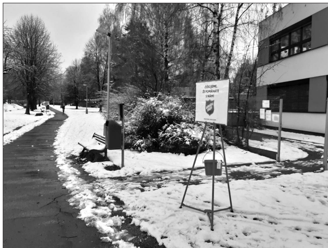
Příspěvek do Kotlíkové sbírky mohou kolemdoucí před vstupem do prostoru Klubu Kamarád, který provozuje Armáda spásy.

Druhou vyhláškou, kterou se rada zabývala, je Obecně závazná vyhláška města Kopřivnice o stanovení podmínek spalování suchých rostlinných materiálů na území města Kopřivnice. „I v této vyhlášce se nic zásadního nemění, jen byla dána do souladu s platnou legislativou,“ upřesnil místostarosta Lakomý a dodal, že obě vyhlášky doporučila rada zastupitelům ke schválení. Jde tak o další úpravy vyhlášek, ke kterým došlo na základě doporučení ministerstva vnitra.