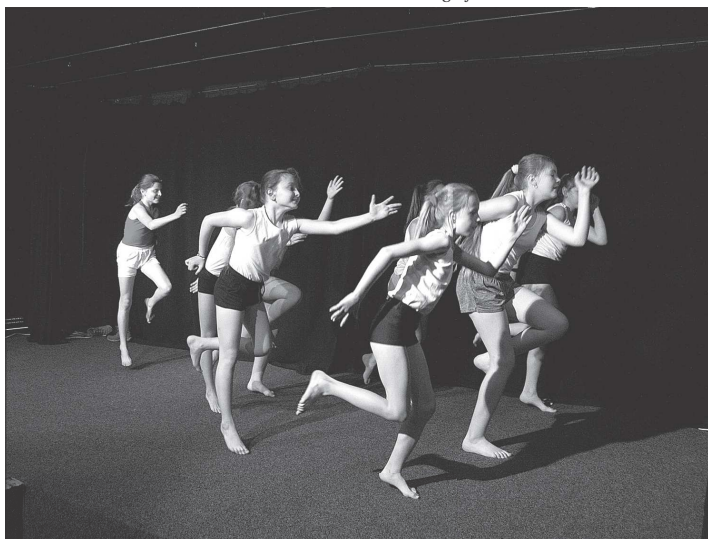
Tanečnice ze ZŠ sv. Zdislavy si na kulturně-dramatické soutěži věnované Emilu Zátopkovi vytančili první místo v mladší kategorii s choreografií na píseň kapely Mirai.