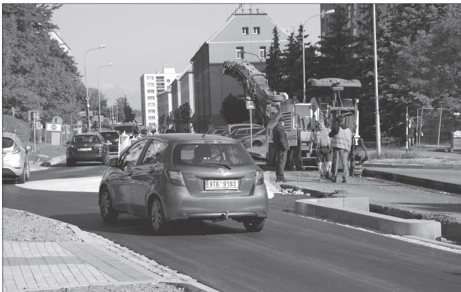
Na začátku tohoto týdne se doprava na ulici Obránců míru přenesla na nově vybudovanou okružní křižovatku. Její druhá polovina vzniká v těchto týdnech. Dokončena má být do konce června.

Úspory budou plynout nejen z nových osvětlovacích těles, kde budou nahrazeny sodíkové výbojky úspornějšími LED svítidly, další úspory budou plynout z nahrazení dožívajících hliníkových rozvodů měděnými vodiči, které mají podstatně nižší energetickou ztrátu. (Pokračování na straně 2)