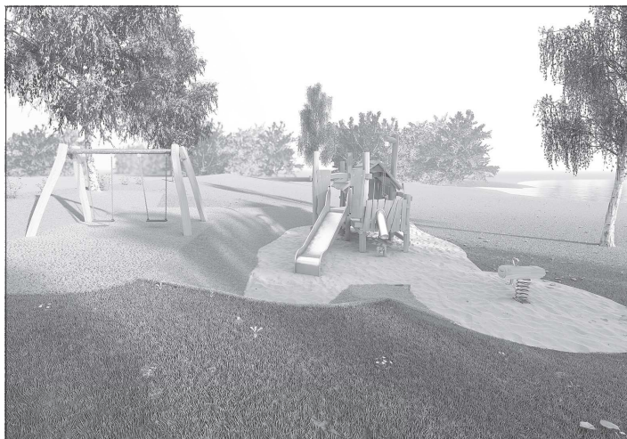
Vizualizace nového dětského hřiště, které by mělo vzniknout na Větrkovické přehradě. Realizováno by mohlo být ještě před začátkem letní sezony.

účelem snížení spotřeby energií. Členové této skupiny budou ve spolupráci s odborníky rozhodovat například o teplotě světla, kterou bude město využívat. „Bude třeba najít kompromis mezi různými pohledy na věc, zatímco experti na životní prostředí upřednostňují barvu světla okolo 2 000 K, energetici upřednostňují světlo okolo 5 000 K, kde se dosahuje podstatně vyšších úspor,“ vysvětlil Adam Ondrašík. Kopřivnice zvažuje, že při modernizaci systému pouličního osvětlení si finančně vypomůže i vypsáním dotačních programů. „Kromě přímých dotačních prostředků by celou investici mohly pomoci zaplatit i předpokládané úspory, jejichž konkrétní výši je ovšem nyní těžké odhadovat, a i proto, že v tuto chvíli není možné znát cenu elektrické energie v dalších letech. Obecně však platí princip, čím vyšší cena, tím vyšší jsou i úspory,“ uzavřel Dušan Krompolec.