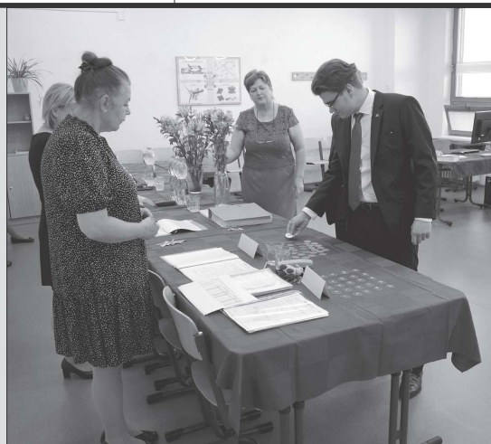
Losováním příslušné maturitní otázky začaly ústní zkoušky na zdejší VOŠ, SOŠ a SOU Kopřivnice.