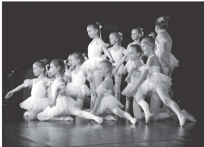
Zákyně 2. ročníku tanečního oboru zdejší ZUŠ Zdeňka Buriana přispěly do dvakrát vyprodaného tanečního koncertu choreografií Labuté.

čeká v neděli nejen premiéra, ale také návrat před publikum po nezvykle dlouhé době. Naposledy totiž hráli v září 2019 na zájezdu v Libhošti, následně pak vystupování hatily covidové restriktce, nemocnost v souboru, případně pracovní vytíženost amatérských herců.