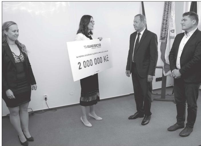
V pátek 20. května došlo k oficiálnímu předání dvoumilionového daru společnosti Tawesco, která má Kopřivnici pomoci řešit rozšíření kapacity mateřských škol.