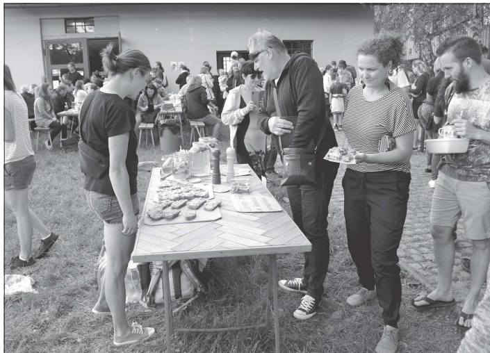
Neřední Restaurant Day přilákal tolik zájemců, že jednodenní restaurace amatérských kuchařů zůstaly otevřené ani ne celou hodinu.

Objektu v roce 2008 zrušené školy chce město dát nový život. Kromě knihovny v historické části někdejší školy má v její přístavbě vzniknout atraktivní bydlení. I tento záměr má radnice rozpracovaný ve formě studie. První pokus o nalezení firmy, která by projekt realizovala, nevyšel. Do soutěže o zakázku se nepřihlásil žádný zájemce. Město v tomto případě chtělo poprvé zadat podobnou veřejnou stavbu metodou Design & Build. To v praxi znamená, že dodavatel stavebních prací ji provede podle prováděcí projektové dokumentace, kterou si na základě detailního zadání města sám zpracuje. To má předcházet tomu, aby se realizátor stavby nemohl odkazovat na nedostatky projektu a na jejich základě zvyšovat cenu nebo prodlužovat dohodnutou dobu stavby. Zadávací řízení bylo po úpravě a změkčení některých jeho podmínek vyhlášeno znovu a uchazeči mohou své nabídky městu posílat do 30. května.