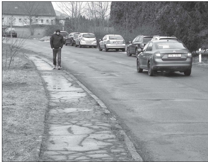
Chodci se mají už brzy dočkat nejen opravy, ale i prodloužení chodníku na ulici Severní. Přibude také doposud scházející veřejné osvětlení.

Radnice podle starostových slov řeší i individuální žádosti o podporu od podnikatelů, kteří nespĺňují kritéria dotačního programu. „I když ne všem je možné vyhovět, každou žádost pečlivě zvažujeme. Ne vždy je ale za poklesem tržeb omezení v centru. Často může jít o kombinaci mnoha jiných faktorů, které město neovlivní, a taková podpora by byla nesystémová,“ uzavřel starosta Hanus.