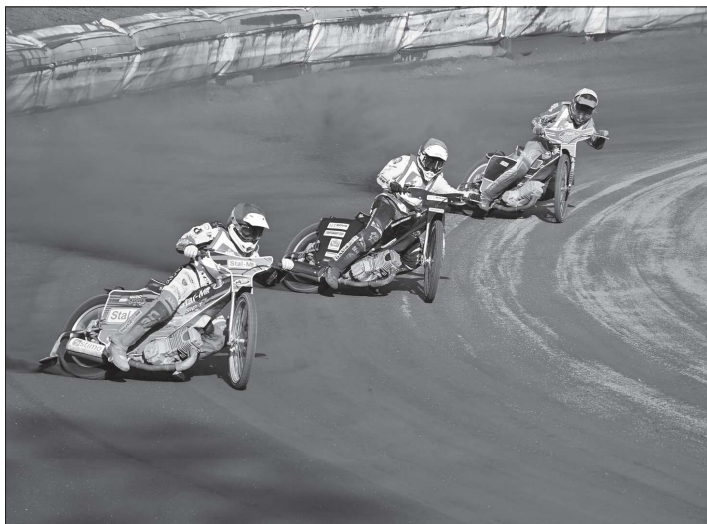
Fanoušci ploché dráhy v Kopřivnici se mohou v tomto roce těšit na pořádnou porci závodů, poprvé se přijde na „plošinu“ už na začátku května.

Klub se v důsledku těchto událostí nepřihlásil do nového ročníku první ligy družstev a zůstával v nejistotě. Naštěstí ne na dlouho. Hned zkraje nového roku přišly velmi dobré zprávy, které možná i překonaly představy fanoušků. Vedení klubu v sestavě Tomáš