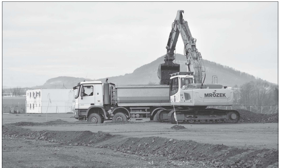
Stavba Integrovaného výjezdového centra, kde budou už letos fungovat hasiči i zdravotníci záchranáři, je zatím ve fázi zemních prací. Prozatímní stanice (v pozadí snímku) zmizí už v dubnu a jednotka se na několik měsíců přesune do pronajatého objektu v areálu Tatry. Na dojezdové časy změna umístění nebude mít vliv.

Novým působištěm hasičů bude objekt poblíž současného servisního střediska Tatra Trucks na ulici Panské. „Náhradní prostory, ve kterých bude hasičská stanice umístěna, se nacházejí v těsné blízkosti stávající provizorní stanice a negativně neovlivní dojezdové časy do žádných lokalit v operační působnosti kopřivnické jednotky,“ ujistila mluvčí hasičů Kamila Langerová. (Pokračování na straně 2)