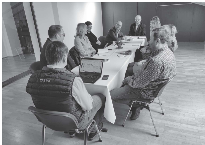
Přímou na půdě Lašského muzea proběhla koordinační schůzka, jejímž cílem bylo posunout projekt nové expozice kopřivnické keramiky blíž k realizaci.

V celostátním měřítku v lednu po dlouhé době došlo k situaci, že počet nezaměstnaných byl vyšší než počet nabízených volných pracovních míst. Stejná situace platí i v novojičínském okrese, kde na jedno pracovní místo připadá 1,62 uchazeče o zaměstnání. Přímou v Kopřivnici pak zatím stále, i když už jen nepatrně, přetrvává stav, kdy zaměstnavatelé poptávají více lidí, než je dosažitelných ve statistikách úřadu práce. Na konci ledna bylo dosažitelných 914 uchazečů o zaměstnání a v nabídce bylo 919 volných míst, oproti prosinci jich přitom znovu o několik desítek ubylo.