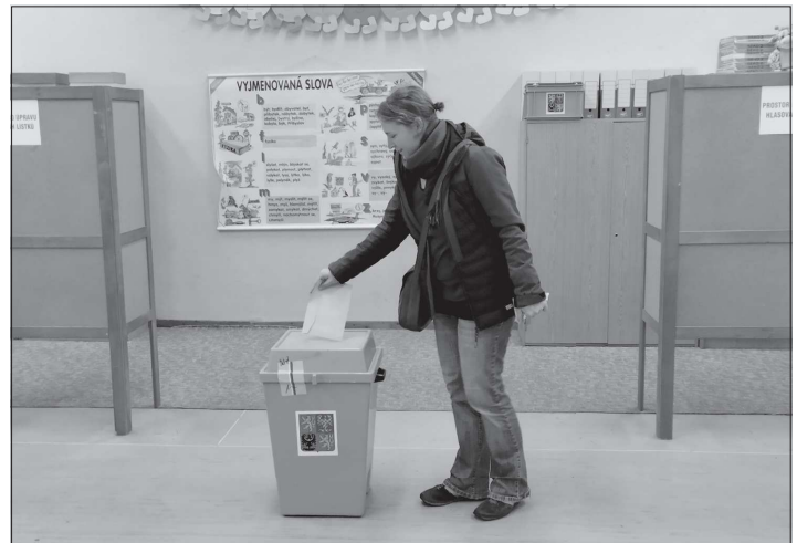
Už zítra úderem 14. hodiny se znovu otevřou volební místnosti. Druhé kolo prezidentské volby skončí v sobotu dvě hodiny po poledni.

Policisté z Obvodního oddělení v Koprivnici v těchto dnech ve zkráceném přípravném řízení sdělili podezření ze spáchání přečinu porušování domovní svobody a přečinu krádeže 30letému muži z Novojičinska, neboť tento podle všech doposud zjištěných a prokázaných skutečností v noci z 5. na 6. ledna neoprávněně vstoupil na oplocený pozemek jednoho z rodinných domů na ulici Dražné a Štramberku, kde z přilehlé terasy domu odcizil uschované vánoční cukroví a dvě láhve vína, čímž poškozené místní majitelce vznikla celková hmotná škoda na majetku ve výši 800 korun. Celá záležitost je nadále v prošetřování ze strany koprivnických policistů a novojičinských kriminalistů.