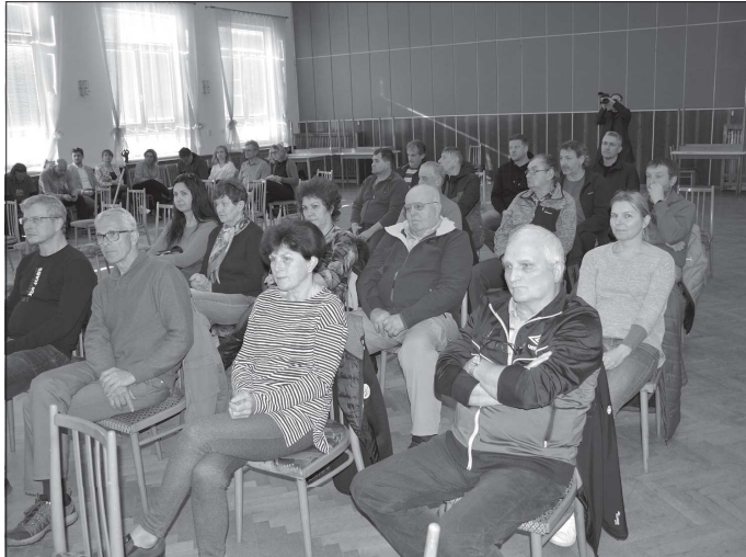
Také letos se uskuteční tradiční veřejné schůze v jednotlivých místních částech. Termín byl stanovena na polovinu dubna.

Data budou odborníci získávat jak z veřejných zdrojů, účetních závěrek a podobně, tak osobními konzultacemi s jednotlivými radnicemi nebo provozovateli sportovišť. Sběr dat by měl být dokončen v dubnu, následně vyhodnocení a analýza budou trvat zhruba čtyři měsíce. V srpnu má Koprivnice mít k dispozici souhrnnou zprávu. Po ní pak bude na podzim následovat konference za účasti zapojených měst, kde dojde k porovnání výsledků i ke sdílení dobré praxe. Benchmarkingová analýza sportu ve městě přijde koprivnickou městskou kasu na 22 tisíc korun.