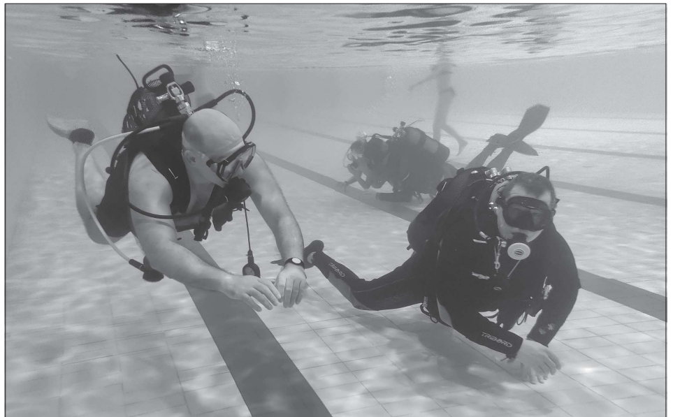
Kopřivnický krytý bazén o minulém víkendu slavil 30 let od svého otevření. V sobotu si návštěvníci kromě sníženého vstupného mohli užít ukázkou přístrojového potápění. V neděli pak byly k dispozici vodní atrakce.