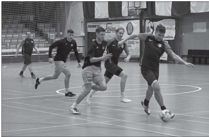
V tomto utkání Ámos Cupu futsalisté Vegas porazili tým FU 4:1, a zajistili si tak třetí místo. Turnaj vyhrál tým Kamarádi.