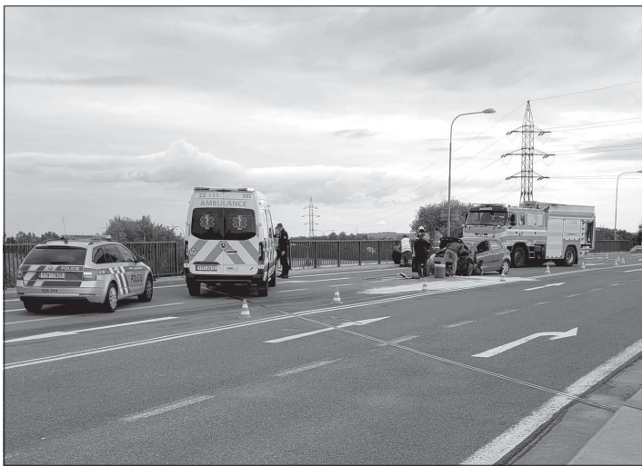
V červenci vyjžděli dobrovolní hasiči k dopravní nehodě, kdy osobní auto narazilo do zábradlí, které spadlo na koleje, do něhož následně narazil projíždějící vlak.

29. prosince byl na operační středisko Hasičského záchranného sboru ohlášen výbuch a následná destrukce v bytové jednotce v domě na ulici Štramberské. Na místo bylo ihned vysláno několik jednotek včetně speciální