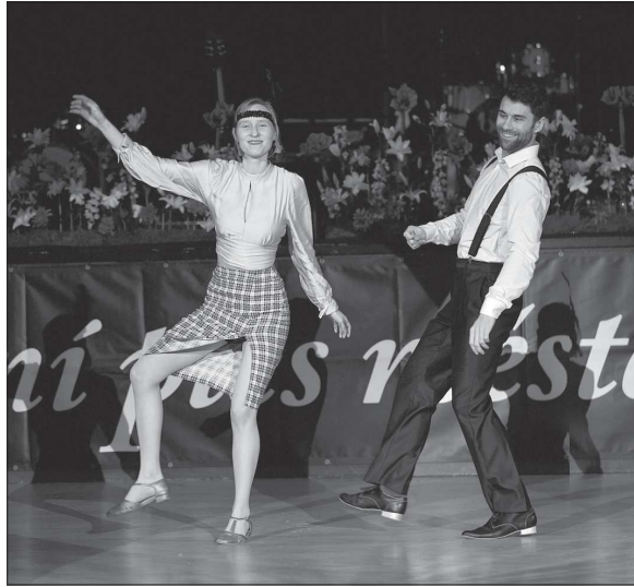
Sobotní noc patřila v kopřivnickém kulturním domě jubilejnímu, 30. ročníku Obecního plesu, který se tentokrát stylově přenesl do 20. let 20. století.

Lidé si seznam míst s vystavenými betlémy mohou najít na internetu a vyrazit na trasu vedoucí od kapličky v Národním sadu přes náměstí až do hotelu Roubenka. Nebo si mapku s jednotlivými zastaveními a popisky mohou vyzvednout v informačním centru na náměstí. V prosinci proběhly také tři komentované prohlídky betlémů. Nyní v závěru výstavy se budou muset lidé obejít už bez výkladu. O letošní novinku ale ochuzení nebudou. Tou je zastavení v Muzeu Zdeňka Buriana, které v běžné otevírací době nabízí možnost prohlédnout si papírové a jiné betlémy ze sbírky města Štramberka a v 1. patře v rámci výstavy 100 let Národního sadu kopii původního betlému z kapličky v Národním sadu. Tematická procházka Moravským Betlémem podle organizátorů zabere zájemcům zhruba dvě hodiny času.