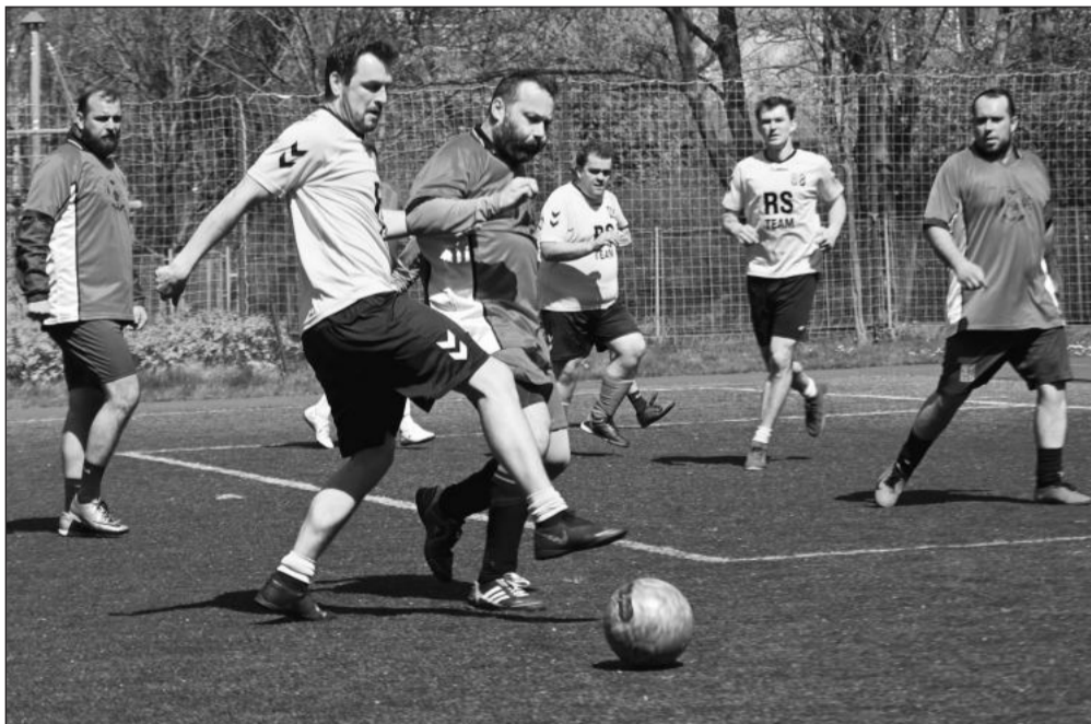
Hráči RS Teamu (světlejší dresy) potvrdili roli favorita a v jednom z utkání prvního kola nově sezony porazili JURA Krejčí team 5:2.

Kopřivnice (mha) – Na umělé na hřišti u ZŠ dr. Horákové v Kopřivnici se rozehrál svým prvním kolem nový ročník oblastního přeboru v malém fotbalu, do kterého se přihlásilo celkem šest družstev. Všechny týmy se představily hned v prvním z celkových