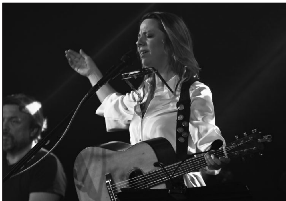
Zpěvačka Aneta Langerová koncertovala v kopřivnickém kulturním domě v rámci turné ke své zatím poslední desce Dvě slunce.