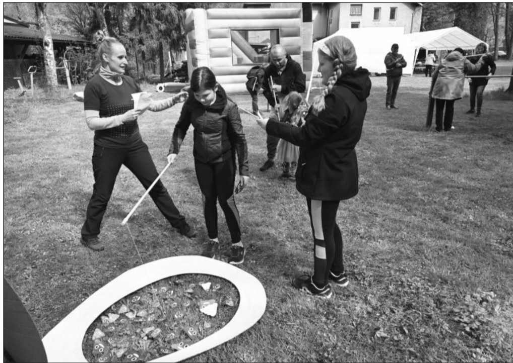
Minulou sobotu proběhlo na zahradě Vlčovjanu zábavné odpoledne, které symbolicky ukončilo výstavbu kanalizace ve Vlčovcích a Mniš.