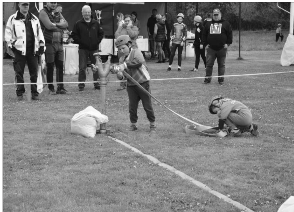
Na závodech v Lubině bylo znát, že jde o jeden z prvních závodů po zimní pauze. Mladí hasiči dělali hodně chyb a také jim chyběla sebranost.