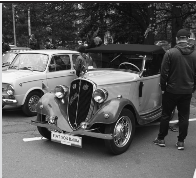
Nejstarší vůz zúčastněný na srazu fanoušků italských automobilových značek byl Fiat 508 Balilla z roku 1935.

Zatímco účastníci srazu absolvovali prohlídky v Technickém muzeu Tatra, veřejnost mohla okolo poledne obdivovat zhruba padesátku přihlášených vozů, které byly zaparkovány před budovou zdejší radnice. K vidění byly nejen fiaty, ale i vozy dalších italských automobilů jako alfa romeo, lancia nebo maserati. Nejstarší byl Fiat 508 Balilla z roku 1935, nejnovější naopak Fiat Barchetta z roku 1997.