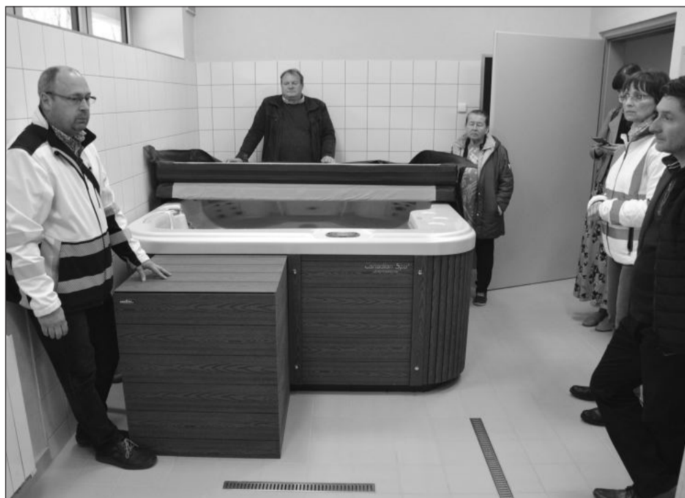
Součástí rekonstrukce přízemí tribuny letního stadionu Emila Zátopka byla i výstavba zázemí pro regeneraci sportovců včetně instalace nové vřítkvy.

Na skončenou první etapu rekonstrukce má navázat další spočívající v opravě druhého podlaží objektu, ve kterém jsou kromě kanceláří také multifunkční místnosti, někdejší restaurace a sociální zařízení pro návštěvníky sportovních akcí. Součástí druhé etapy bude rovněž kompletní výměna topení a rozvodů tepla a zateplení objektu. Počítá se rovněž s instalací fototermitických panelů, které by měly zajistit snížení nákladů na ohřev teplé vody či otop budovy. Během léta bude radnice hledat zhotovitele, v říjnu po skončení sezony by na místo měli nastoupit opět stavební dělníci.