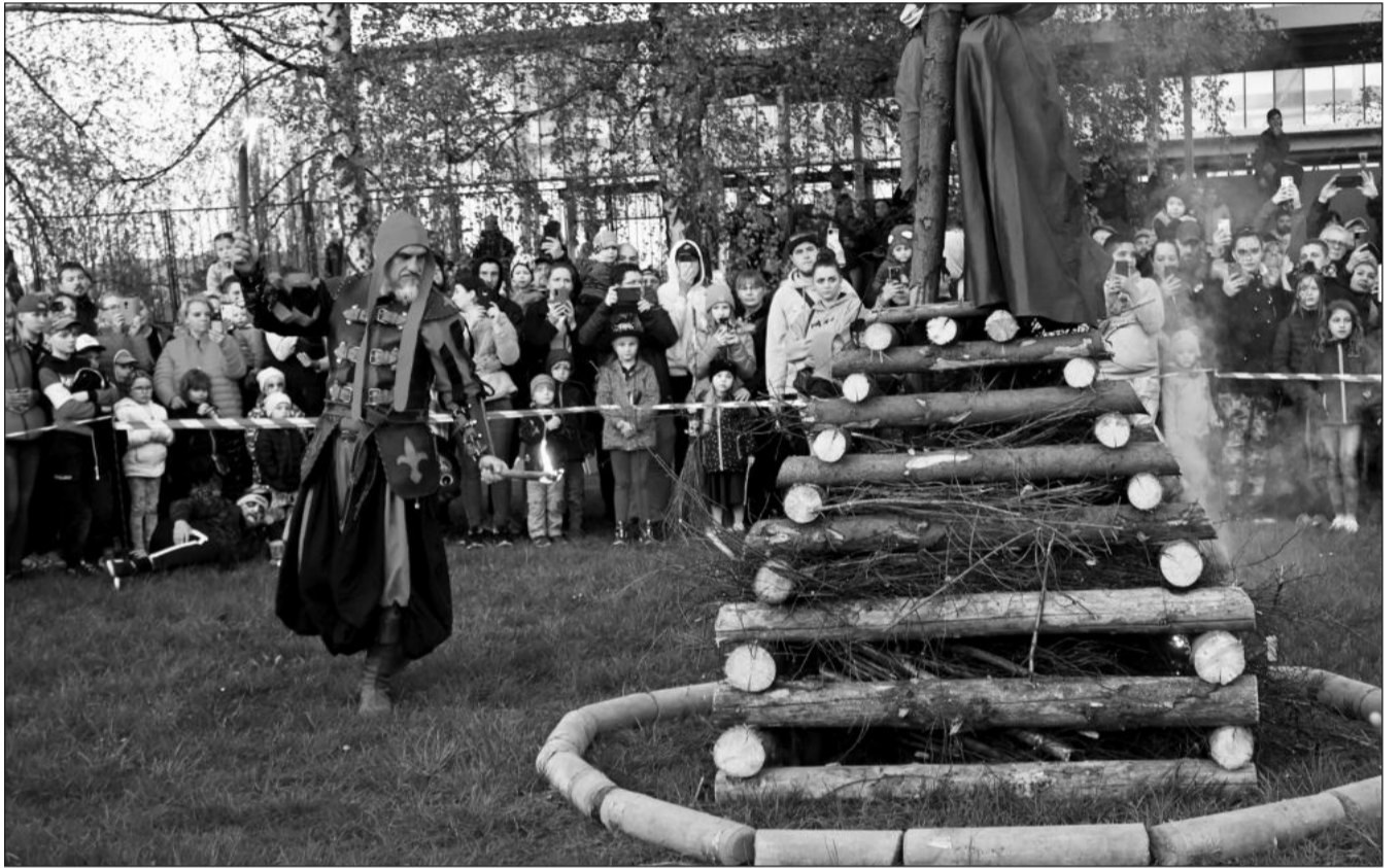
V neděli si Kopřivnice užila oslavu Filipojakubské noci. Program v parku navštívili během odpoledne a večera stovky lidí. Vyvrcholil krátce po osm, kdy mistr popravčí obřadně zapálil symbolickou vatru s čarodějnicí.