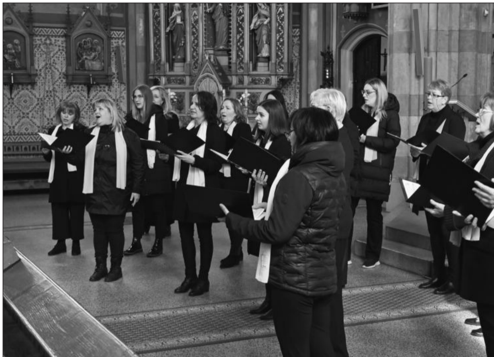
Ženský pěvecký sbor Cantus Venuste uskutečnil minulou sobotu Jarní koncert, jehož program byl složený z lidové a duchovní hudby.