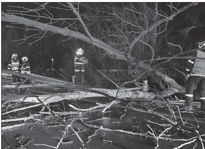
Během prvního pololetí vyjela jednotka kopřivnických hasičů k 57 událostem. Meziročně jde o významný pokles.

Javorníku, které bylo zaměřeno na koordinaci jednotek při zásobování požární vodou. Náročný kopcovitý terén s úzkými lesními cestami kladl zvýšené nároky hlavně na strojníky, ale také na samotnou techniku. Taktické řízení v místě zásahu a zejména koordinace kyvadlové dopravy vody cisternami po úzkých lesních cestách, znemožňující hladký obousměrný provoz, byly zase oříškem pro velitele zásahu.