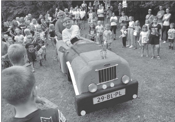
Včlivočtí hasiči pořádali poslední srpnovou sobotu svůj tradiční dětský den. Tentokrát si pro dva malé účastníky připravili netradiční soutěžní úkoly kutilové Pat a Mat.

Prioritou radnice je podle starosty Hanuse rychlé a kvalitní dokončení stavby, a proto v tuto chvíli také odmítá mluvit o případných smluvních sankcích za nedodržení smluvních termínů s tím, že na jejich vyčíslení a uplatnění bude čas až poté, co bude dokončená stavba sloužit obyvatelům a návštěvníkům Kopřivnice.