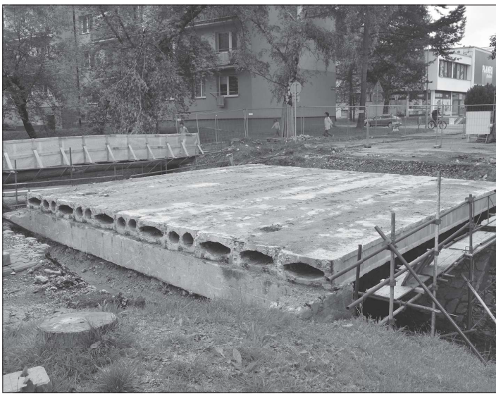
Až demoliční práce umožnily posouzení stavu příčných nosníků mostu na ulici Kpt. Jaroše. Statik doporučil jejich kompletní výměnu, což stavbu značně protáhne.