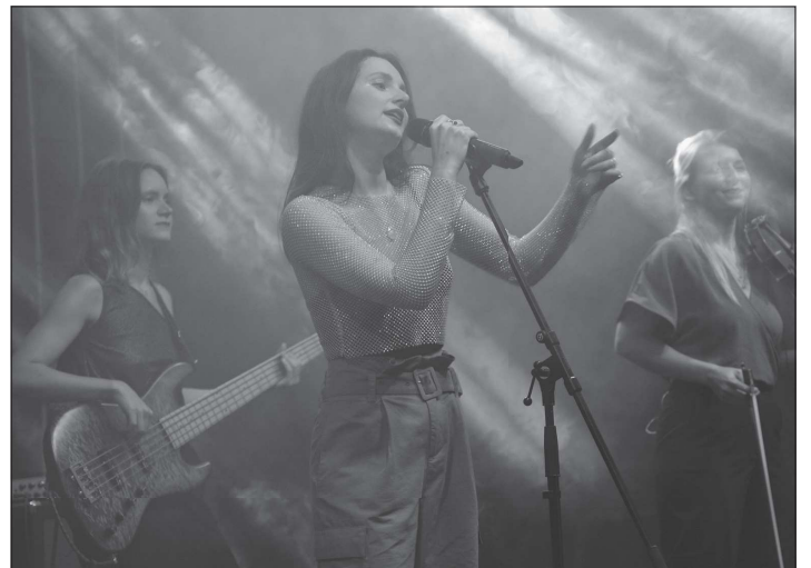
Lákadlem večerní části kulturního programu bylo vystoupení čistě ženské kapely Vesna, která letos na jaře Česko úspěšně reprezentovala v Eurovizii.