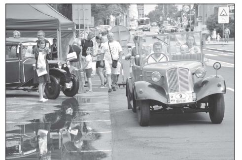
Ke kopřivnické pouti už léta neodmyslitelně patří možnost pro-jízdky v tatrouáčkových veteránech ulicemi města i Tatrou.