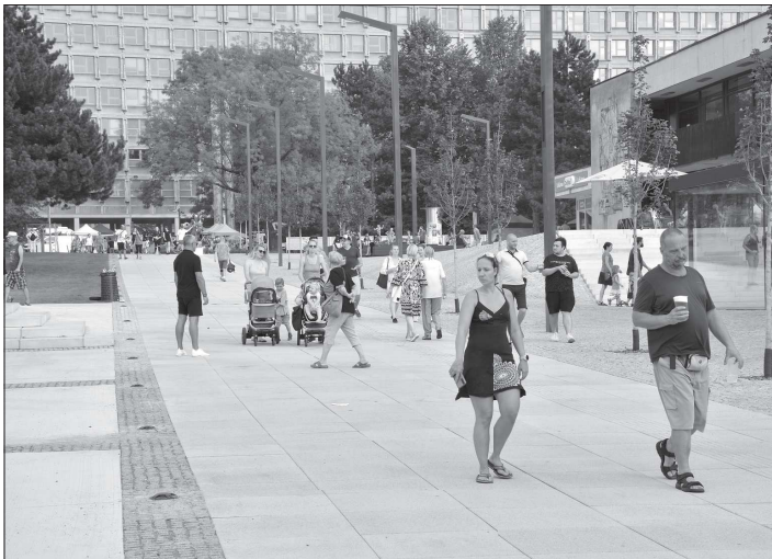
Během poutového víkendu prošlo revitalizovaným centrem mnoho lidí. Přesto je střed města oficiálně stavbou a firma pracuje na dokončení a odstraňování vad. FOTO: DAVID MACHÁČEK