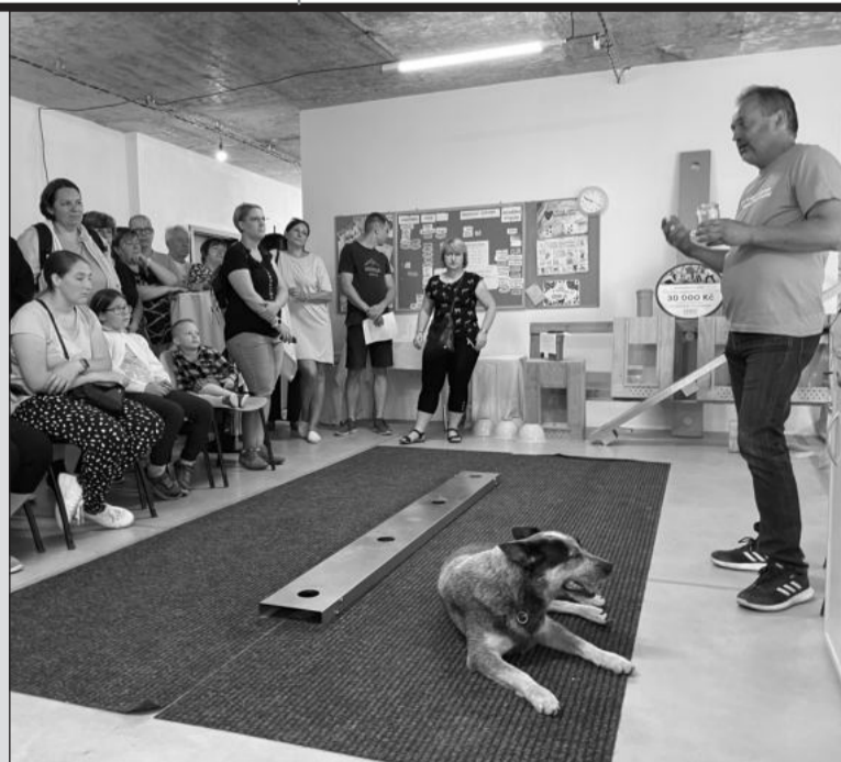
Součástí dne otevřených dveří v sídle Českého centra signálních zvířat byly i ukázky výcviku psů.