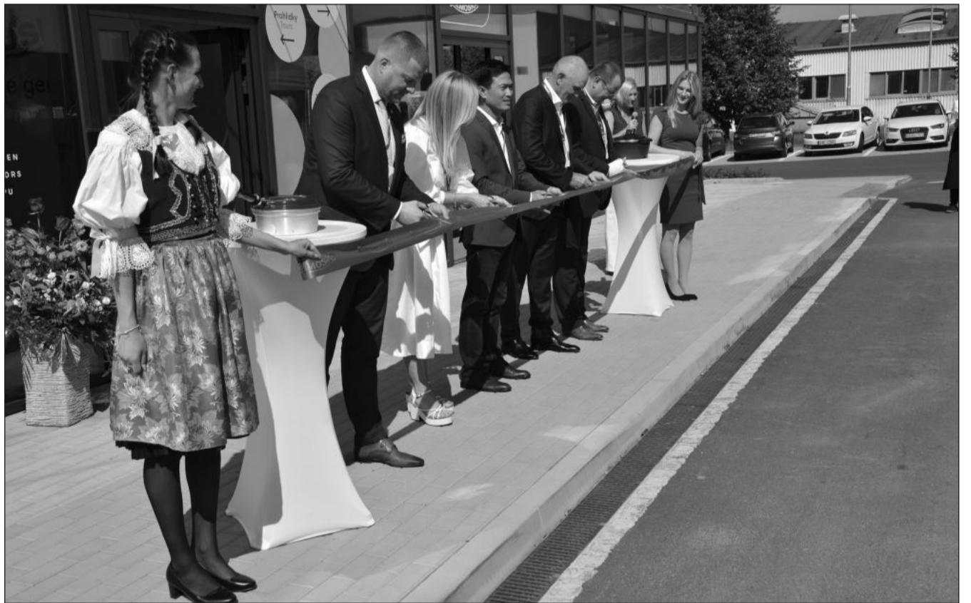
Firma Remoska před týdnem oficiálně otevřela svůj výrobní závod v průmyslovém parku. Výroba nádobí i ikonických pečicích mís zatím běží ve zkušebním režimu. S postupným navyšováním produkce se má zvyšovat i počet zaměstnanců.