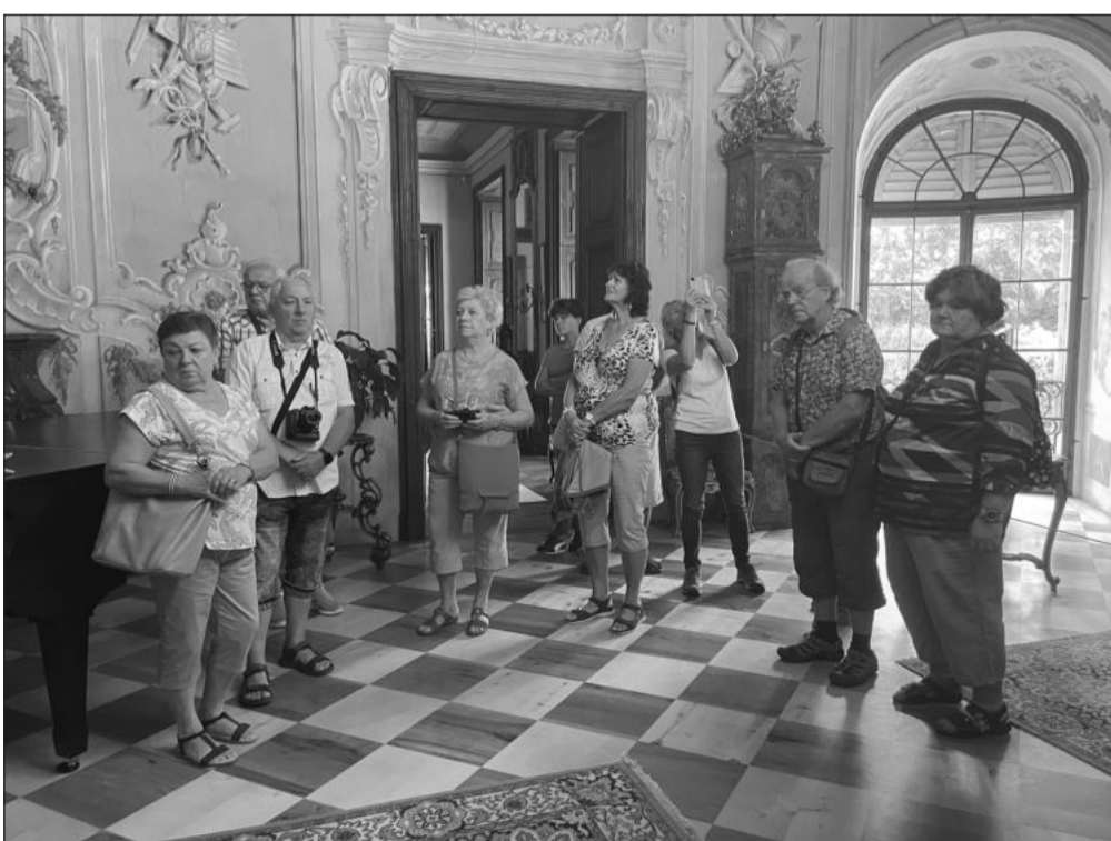
Senioři si na zájezdu, pořádaném kopřivnickou radnicí, prohlédli nejen zámek ve Vizovicích, ale i tamní palírnu a čokoládovnu.

Akce pro seniory organizuje radnice s dalšími subjekty již jedenáctým rokem. Jejich cílem je zpestřit dříve narozeným kopřivničankám nabídku volnočasových aktivit s ohledem na jejich zájmy a kondici, což se jim dle počtu účastníků jednotlivých akcí daří.