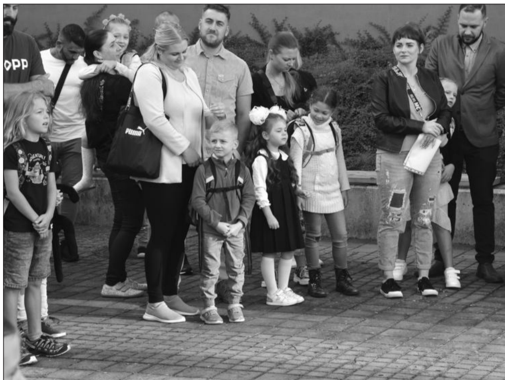
Mezi 253 prvňáky, kteří po prázdninách nastoupili do kopřivnických základních škol, byli i ti, kteří svou docházku začínají na ZŠ Alšova.

Přípravné třídy letos otevřely tři základní školy, a to ZŠ 17. listopadu, Emila Zátopka a dr. Milady Horákové. Posledně jmenovaná tuto třídu otevírala již několik let.