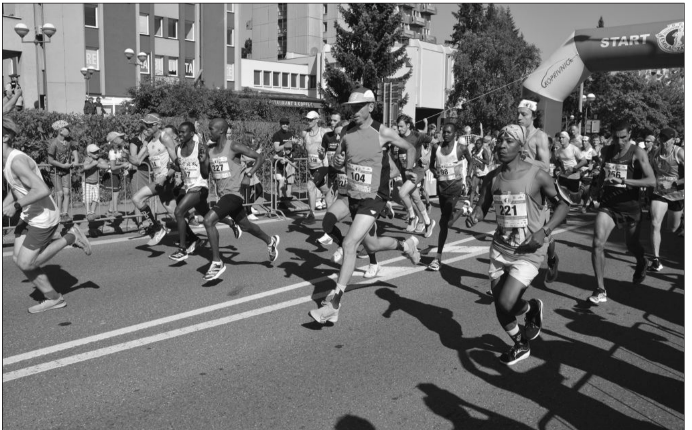
V centru Kopřivnice se na trať 22,3 km dlouhého závodu Běhu rodným krajem Emila Zátopka vydalo 235 jednotlivců a k tomu 26 štafet.

Necelých čtrnáct milionů korun podle prvotního prověření odpovídá stávající podobě projektu. (Pokračování na straně 2)