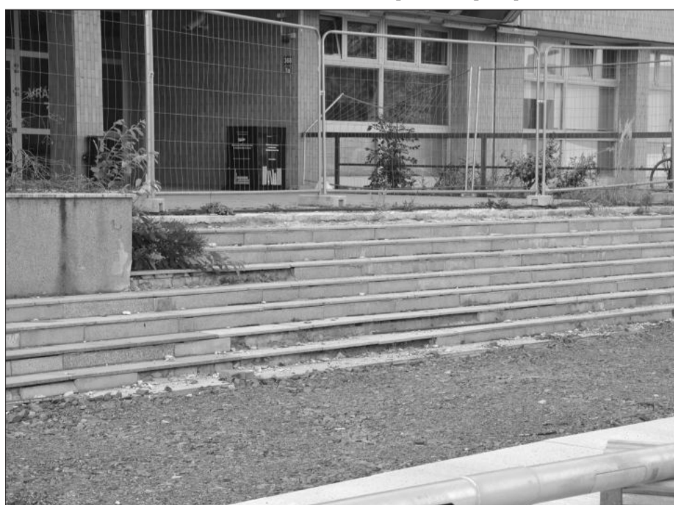
Zchátralé schodiště do budovy kulturního domu se letos dočká jen částečné, provizorní opravy. V příštím roce by pak mělo projít kompletní přestavbou.

Podle původních plánů měla stavba schodiště přímo navázat na dokončování revitalizace centra a v tuto dobu se mělo na schodišti už intenzivně pracovat. Nyní už je jasné, že komplexní stavební řešení přístupu do kulturního domu proběhne až v roce 2024. „V letošním roce provizorně opravíme část přístupového schodiště, aby jej bylo možné bezpečně využívat. Termín zahájení kompletní přestavby bude záležet na tom, jestli bude nutné projekt přepracovat a žádat o nové stavební povolení. V případě zachování stávající podoby projektu můžeme začít v lednu s hledáním dodavatele a na jaře může začít stavba. V případě větších změn se celý harmonogram o několik měsíců posune,“ doplnil Adam Ondrašík.