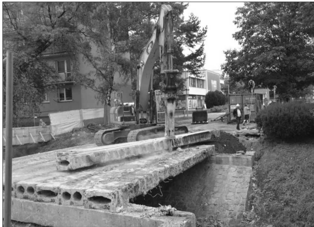
Po rozhodnutí o změně technologie, která bude využita při rekonstrukci mostu na ulici Kpt. Jaroše, začala demolice původních, nevyhovujících konstrukcí mostu.