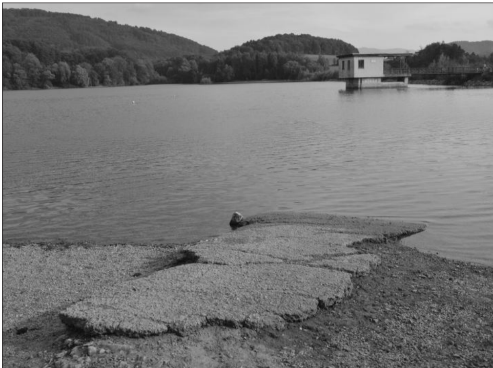
Torzo asfaltové vozovky, která na Větrkovické přehradě vznikla už v době její stavby a nyní se chystá její oprava. Což bylo i důvodem snížení hladiny vody.