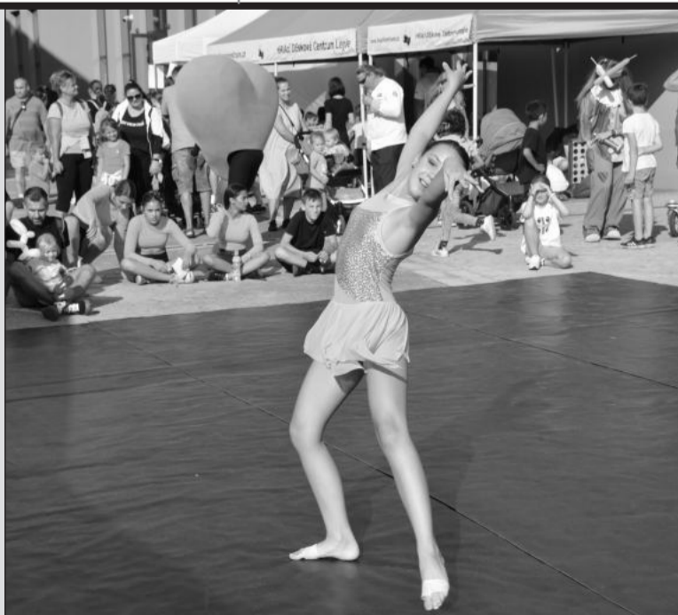
Součástí Dne rodiny pořádaného u muzea nákladních automobilů bylo i vystoupení členek TK Gradus.

Kopřivnice (dam) – Den rodin a Rodinný festival, dvě podobně koncipované i zaměřené akce jen pár desítek metrů od sebe, zpestřily nedělní odpoledne 17. září v Kopřivnici. Den rodin pořádaný v rámci krajské kampaně „Dejme dětem rodinu“ Centrem psychologické pomoci začal už dopoledne možností volných vstupů do Muzea nákladních automobilů Tatra. Od 13. hodiny se pak přidal program se soutěžními a kreativními úkoly pro děti. Ty se kromě možností zasoutěžit si o ceny mohly vyfotit s přistavenými veterány Tatra nebo maskoty akce. Nechybělo ani taneční vystoupení v režii TK Gradus a dětí z příborského dětského domova. (Pokračování na straně 4)