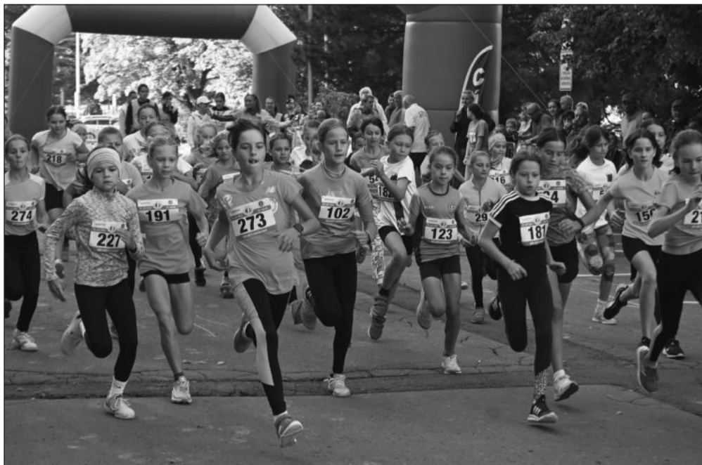
Sobotní dopoledne patřilo dětským běhům u městského úřadu. V sedmi kategoriích bojovali malí běžci a běžkyně na tratích od 75 do 840 metrů.