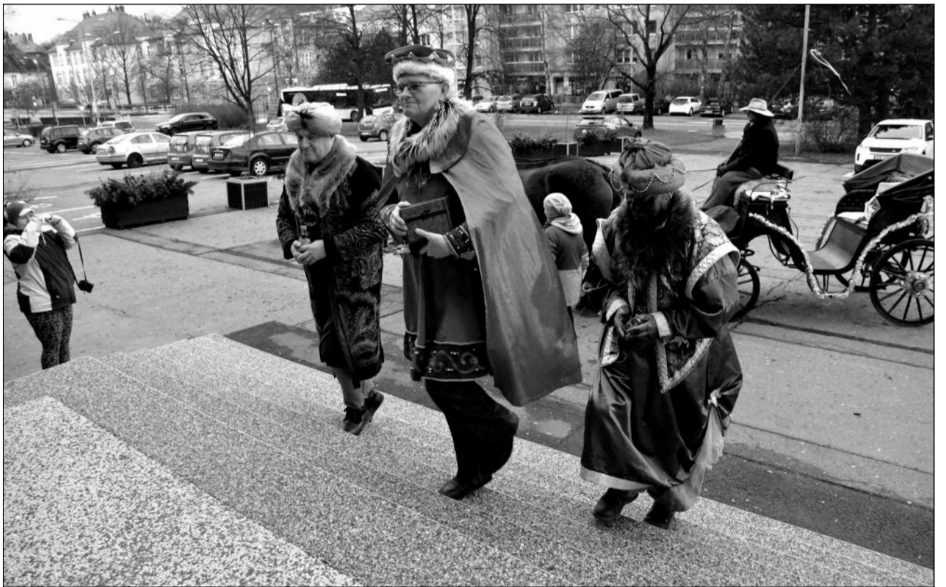
Hned 2. ledna ráno byla v Kopřivnici slavnostně zahájena tradiční Tříkrálová sbírka. Koledníci budou jednotlivě domácnosti navštěvovat až do konce tohoto týdne. Následně ještě sbírka poběží v on-line režimu.