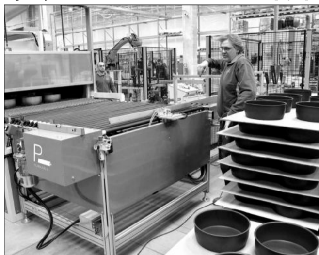
Výrobní závod Remosky spustil linky s vysokou mírou automatizace a zahájil provoz v Kopřivnici.

Po čtvrt století od premiéry se na plátno kopřivnického kina vrátil oscarový Titanic Jamese Camerona. Jeden z nejúspěšnějších filmů historie lidí