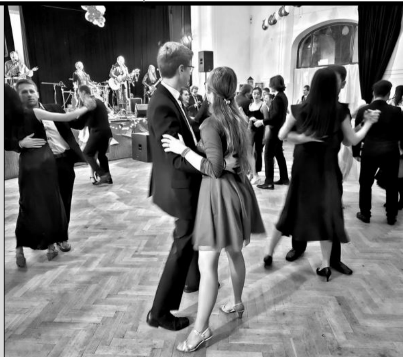
Plesovou sezonu zahájil už minulý pátek Skautský ples v Katolickém domě. Kompletní přehled plesové sezony na straně 2.