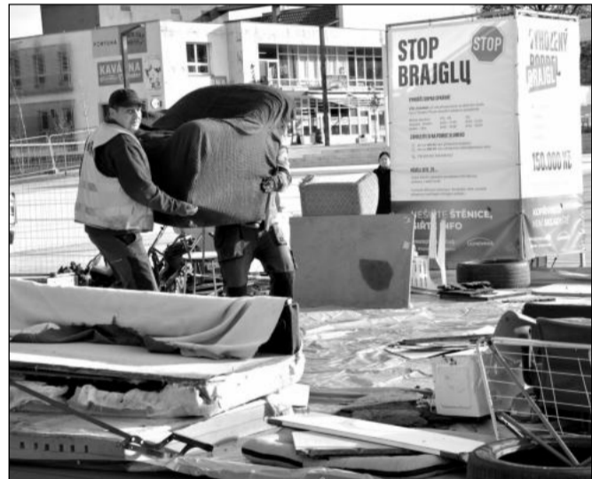
Kampaň Stop brajglu, která má upozornit na ukládání odpadu u kontejnerů, měla velký dosah na sítích i v médiích.

Radní v působnosti valné hromady stvrdili dlouho připravovaný přechod společnosti Slumeko na režim vertikální spolupráce. Schválen byl dokument o reorganizaci společnosti, plán činnosti na letošní