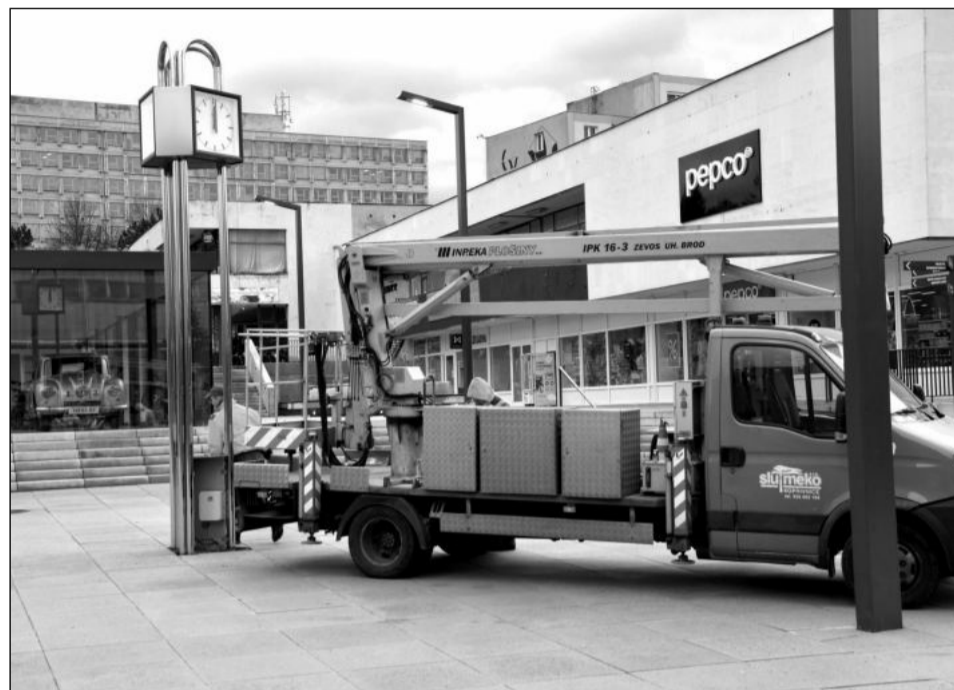
Renovované hodiny z designerské dílny Jiřího Španihela byly minulý týden instalovány na novém místě v centru města.