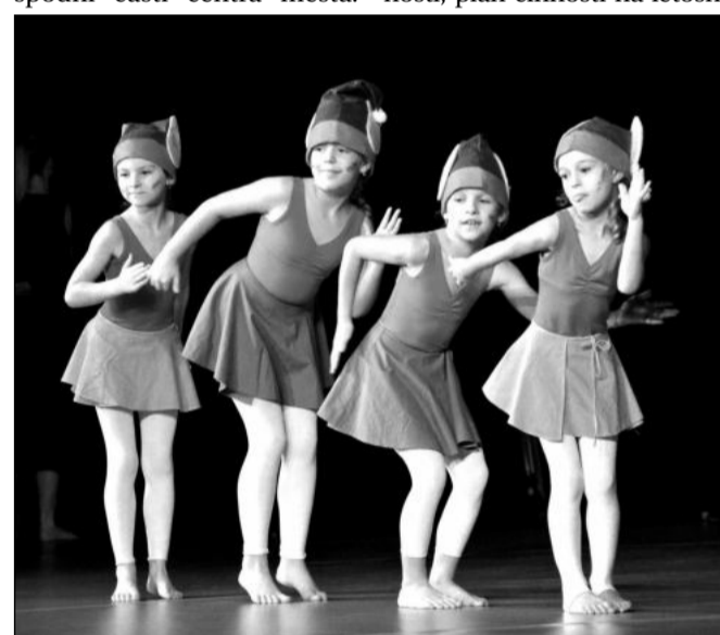
Taneční obor Základní umělecké školy Zdeňka Buriana připravil Vánoční koncert, se kterým dvakrát vyprodal KDK.

Kopřivnicané zahajovali advent ve stínu hned dvou vánočních stromů. Jeden byl vůbec poprvé umístěn na pódiu ve spodní části centra města.