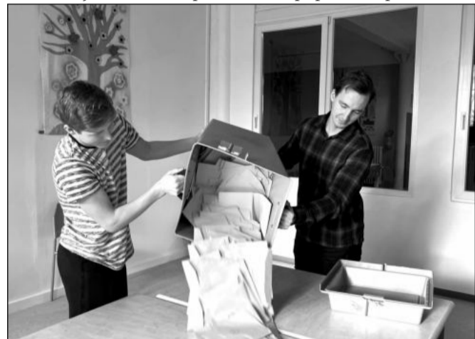
Sečítání volebních hlasů v prezidentských volbách přineslo na konec i v Kopřivnici vítězství Petra Pavla.

Devět představení nabídl 37. ročník divadelní přehlídky Kopřiva. Hrlo se nejen v Katolickém a kulturním domě, ale poprvé také v Muzeu náklad-