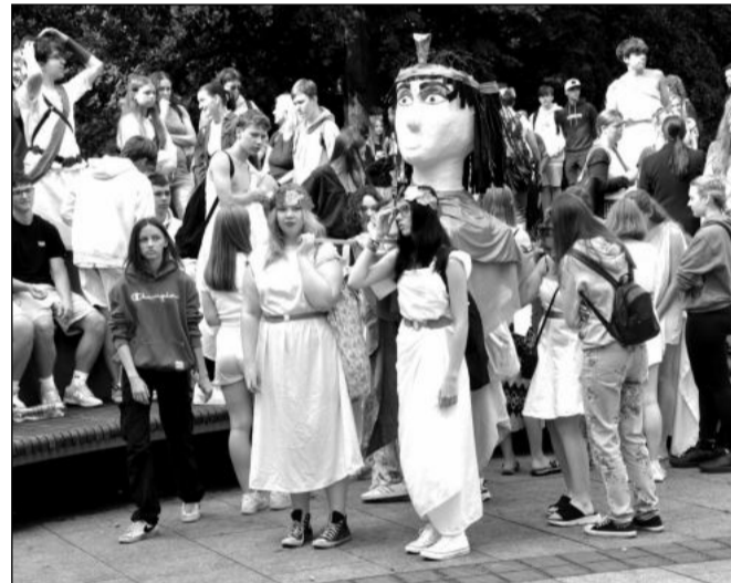
Na konci června došlo k obnově tradice Posledního zvonění pro žáky nejvyšších ročníků místních základních škol.

jedenácti večerů se filmová nadšenci dočkali třinácti projekcí. Návštěvnost byla, zřejmě kvůli špatnému počasí, ještě nižší než v dobách covidové pandemie.