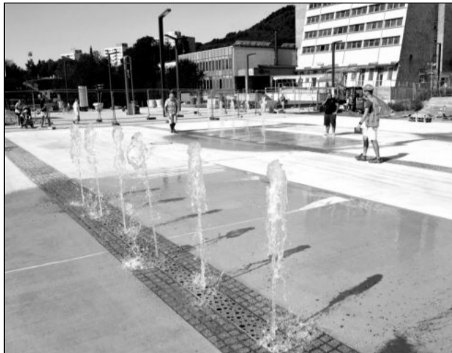
První test vodních prvků v revitalizovaném centru proběhl v druhé polovině července.

Tečku za prázdninovým projektem Někdo ven??? udělala premiéra multizánrové akce Zapoj se. Ta byla postavená na širokém zapojení příchodích. Ti si mohli vyzkoušet řadu výtvarných technik, sami se zapojit do hudebního vystoupení, nahlédnout do zákulisí