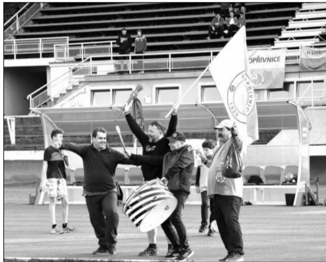
Domácí fanoušci slavili mistrovský titul kopřivnických fotbalistů v 1. B třídě, který znamenal postup do vyšší soutěže.

Začala oprava mostu na ulici Kpt. Jaroše. Důležitá dopravní tepna byla pro auta zcela uzavřena. Po provizorní lávce projdou jen chodci. Později se ukáže, že stav mostu neumožní jeho rekonstrukci, ale vyžádá si výstavbu zcela nového mostu, což záměr nejen prodraží, ale především bude znamenat