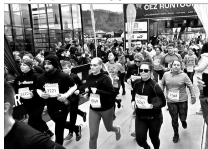
Přes tisíc dospělých běžců a tři stovky dětí vyrazily na trať prvního kopřivnického závodu ze série RunTour.

Kopřivnice zažila reprezentační hokejový svátek – turnaj tří zemí hostila od 7. do 12. února města Nový Jičín a Kopřivnice. Týmy Česka, Švédska a Finska sehrály s každým ze dvou soupeřů dva zápasy. Celkem šest utkání bylo rozděleno