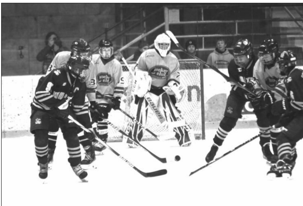
Kopřivnickí devátáci (světlejší dresy) v posledním utkání starého roku před zaplněnou halou porazili kanadské vrstevníky 8:6.