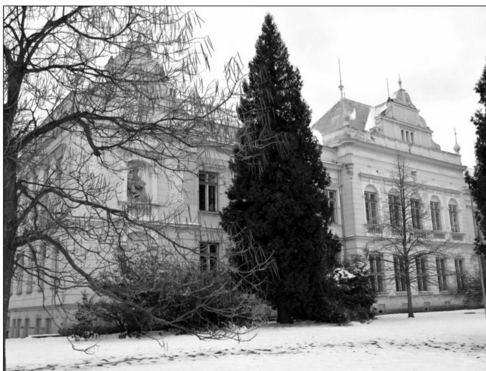
Historická budova někdejší Základní školy Náměstí má být přebudována na moderní knihovnu a komunitní centrum.

Ledová plocha je volně přístupná, pokud není zrovna nastříkaná v rámci údržby ledu. Jak dlouho venkovní kluziště v Mníší vydrží, bude záležet na klimatických podmínkách.