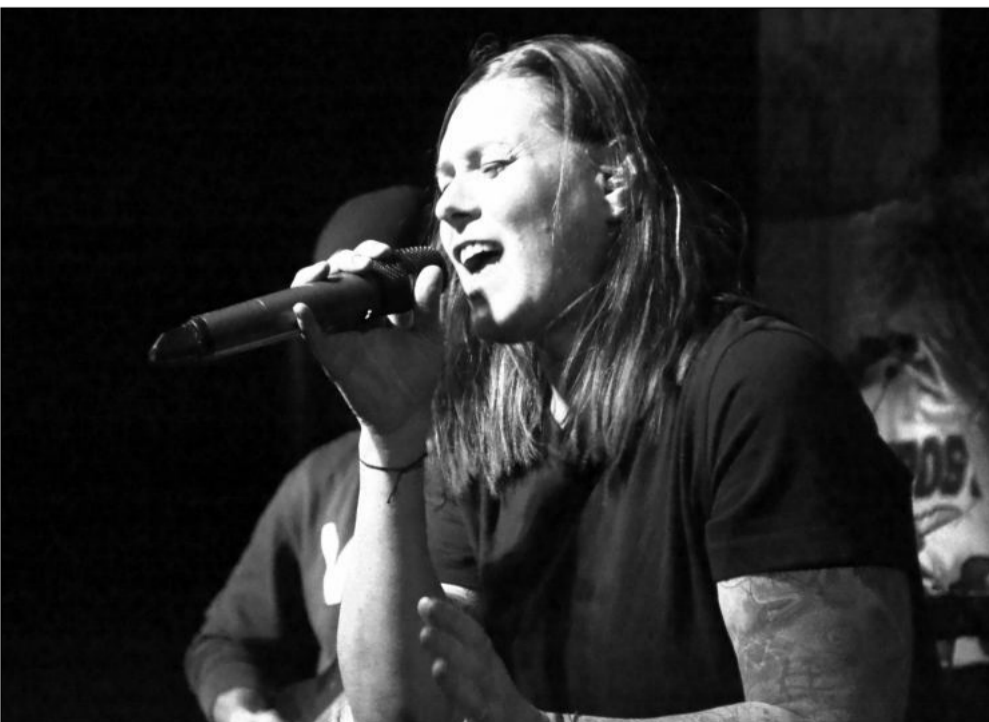
Součástí sobotního programu v baru Fejkovna bylo i vystoupení brněnské posthardcoreové kapely Eponine.