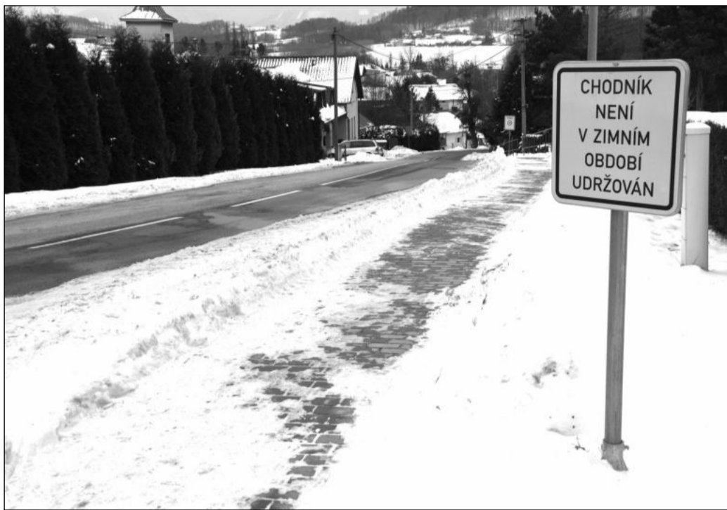
Dokončený chodník podél hlavní komunikace v Mniší už slouží svému účelu, byť v zimě patří mezi ty, které nejsou udržovány.

Náklady stavby dosáhly 9,2 milionu korun, přičemž na její realizaci byla poskytnuta více než čtyřmilionová finanční podpora Evropské unie v rámci Integrovaného regionálního operačního programu.