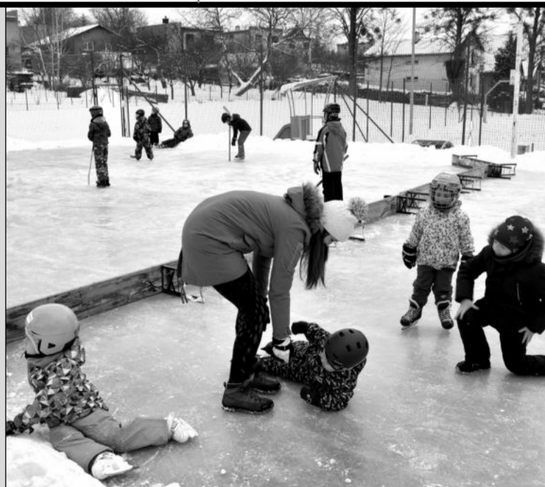
Na improvizovaném kluzišti v Mniši bylo o minulém víkendu živo. Bruslení si lidé užívali i na zamrzlé Větrkovické přehradě.