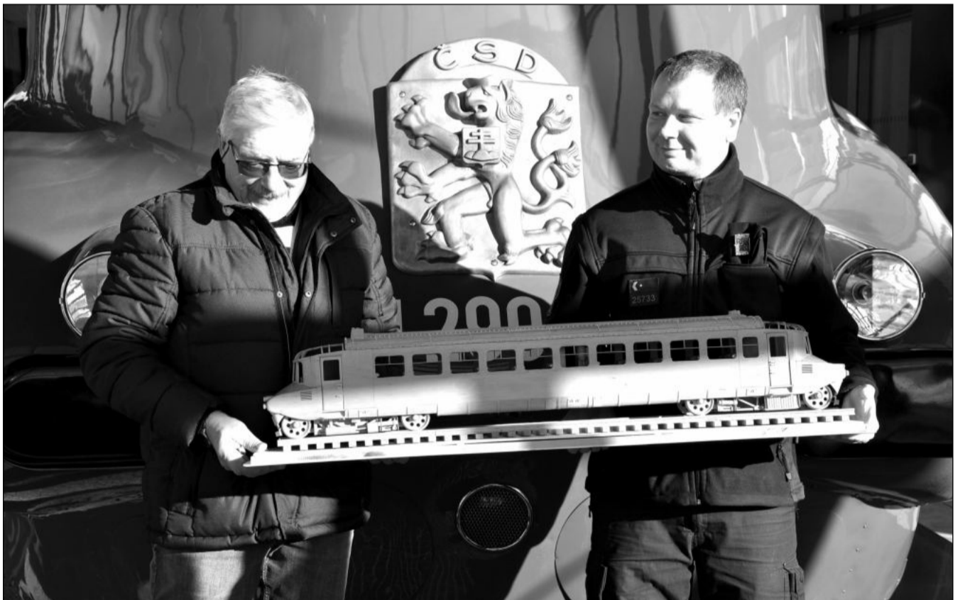
Zástupci vězeňské služby předali v minulém týdnu přímo v depozitáři Slovenské strelý pracovníkům Technického muzea detailní dřevěný model historického železničního vozu, který vytvořil odsouzený ve výkonu trestu.

Úkolem vítěze tendru v odhadované hodnotě 4,1 milionu korun bez DPH bude zpracování projektové dokumentace na realizaci stavby včetně zajištění potřebných podkladů, průzkumů a zaměření. Dokumentace, připravená pro vydání stavebního povolení, má obsahovat také stanovení předpokládaných nákladů stavby. Stejný tým projektantů má připravit i výkresy pro samotné provedení stavby a má být nápomocen také při budoucím výběru dodavatele stavebních prací. Součástí zadávacích podmínek bude i studie z roku 2022, která posuzovala možnosti využití historického objektu právě pro potřeby knihovny a komunitního centra. „Jde o jeden z prioritních projektů a chceme, aby byl řádně projekčně připraven, proto jsme také jako hodnotící kritéria pro výběr projekční kanceláře nastavili pouze cenu, ale budou nás zajímat také reference a zkušenosti projekčního týmu,“ říká starosta Adam Hanus. Při konečném posuzování tak bude mít cenová nabídka váhu 70 %. Pětina bodů v závěrečném hodnocení bude záležet na zkušenostech osoby na postu vedoucího projekčního týmu. (Pokračování na str. 3)