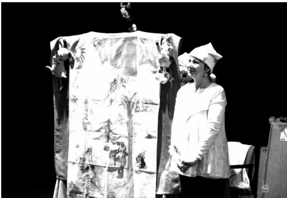
Vlašskomeziříčské Divadlo Leonka uvedlo v rámci pravidelných nedělních divadelních dopolední pro děti své autorské představení Dva sněhuláci.

jemství rostlinného světa, která začíná v 17 hodin, se dozvědí i to, že rostliny nejsou hloupé, dokážou odhadnout rizika a očekávají benefity svého jednání. Řeč bude i o tom, kde mají květiny „oči“, že některé se dají používat jako kompas, že třeba bílé růže mají oproti jiným vysoký obsah bílkovin, a o dalších zajímavostech.