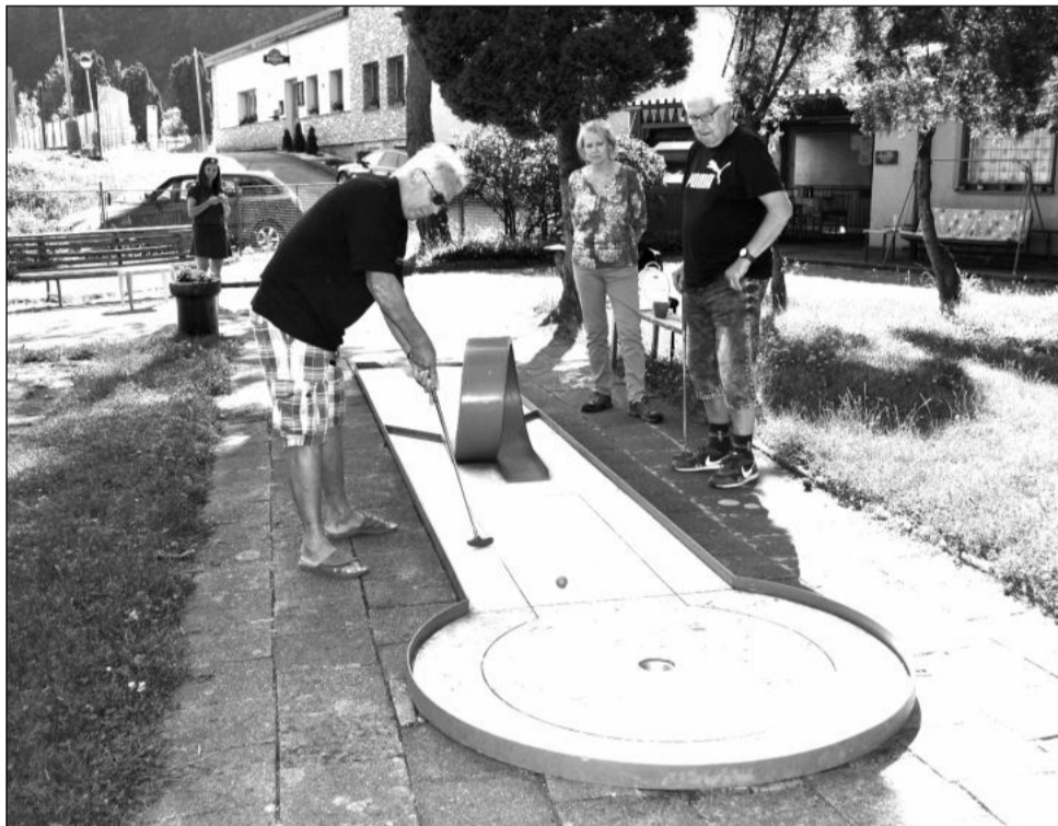
I letos se mohou senioři těšit na své aktivity, mezi které patří tradiční turnaj v minigolfu s názvem Od jamky k jamce.

Po čtyřech letech dochází i ke zvýšení cen. „S ohledem na růst cen materiálu, energie, mzdových prostředků a po porovnání s cenami v okolí bylo navrženo navýšit cenu na úhradu za očkovaní ze 400 na 500 Kč a za pobyt a umístění psa na den na 150 Kč/den, což je navýšení o 50 korun na den. Tímto bych chtěl moc poděkovat zaměstnancům odboru životního prostředí za přípravu dokumentů a také za starost o chod našeho psího útulku,“ doplnil místostarosta Šimíček.