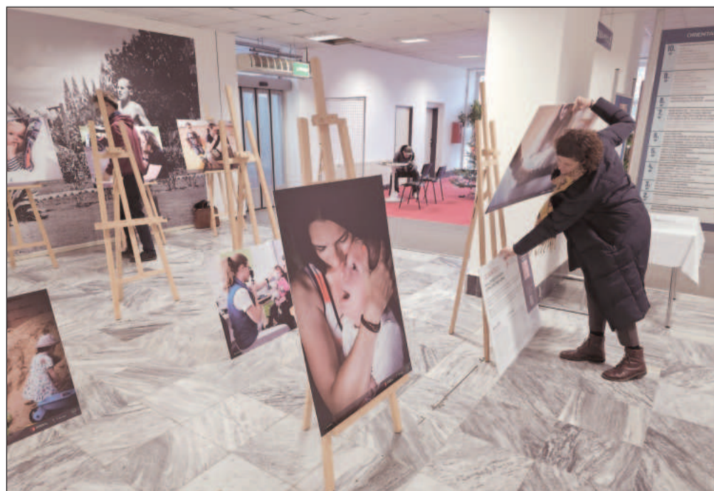
Do 29. ledna je možné ve vestibulu kopřivnické radnice zhlédnout fotografickou výstavu Jeden den zachycující život rodin pečujících o malé děti se zrakovým nebo kombinovaným postižením.

Maximální výši poplatku stanovuje zákon na 1 200 korun, ale takového navýšení se Kopřivničané v tuto chvíli nemusejí obávat. Splatnost poplatku za odpady je 30. června příslušného roku. Městský úřad Kopřivnice nabízí možnost zaslání údajů pro platbu e-mailem. Bližší informace jsou zveřejněny na webu města.