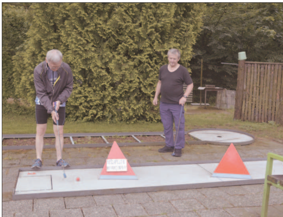
I letos se senioři mohou těšit na červnový turnaj v minigolfu, který se uskuteční v rámci projektu Aktivní senior.

Její příběh je o to silnější, že s chutí pomáhá, přestože sama nemá na různých ustlání. Část svého dětství strávila spolu se sourozenci v dětském domově, který stojí ve stejné ulici jako domov pro seniory.