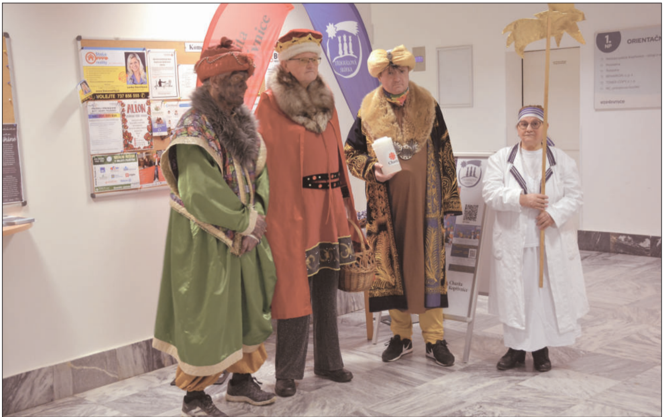
V úterý 14. ledna skončila Tříkrálová sbírka, ale zapojit se do ní a přispět bezhotovostně přímo na speciální účet je možné až do konce dubna. Už v tomto týdnu započalo sčítání koledníků vybraných peněz.