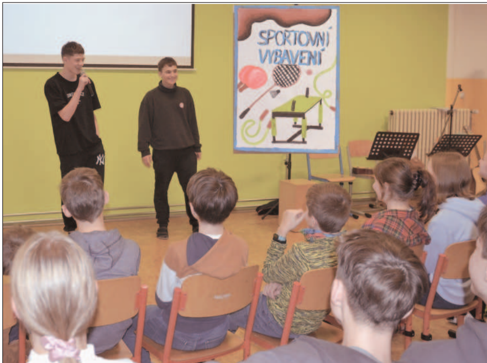
Ve škole sv. Zdislavy vyhrál projekt s názvem Bungee Fitness na pořízení sportovního vybavení.

Další novinkou na úseku občanských průkazů je možnost požádat o občanský průkaz a následně převzít i na pověřeném zastupitelském úřadu. Dosud bylo možné na zastupitelských úřadech v zahraničí žádat pouze o cestovní pasy.