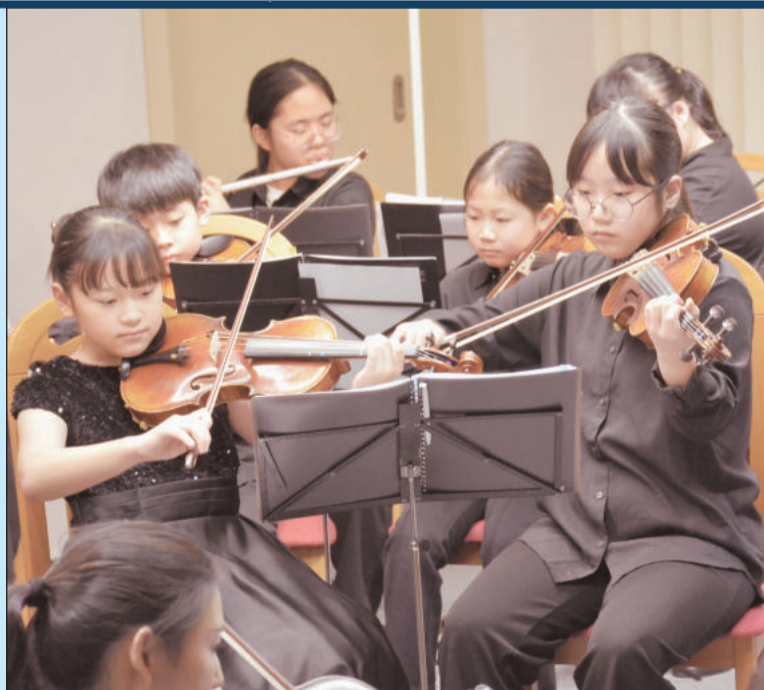
V rámci svého turné po evropských zemích vystoupil Kyungnam Youth Orchestra i v koncertním sále zdejší ZUŠ.