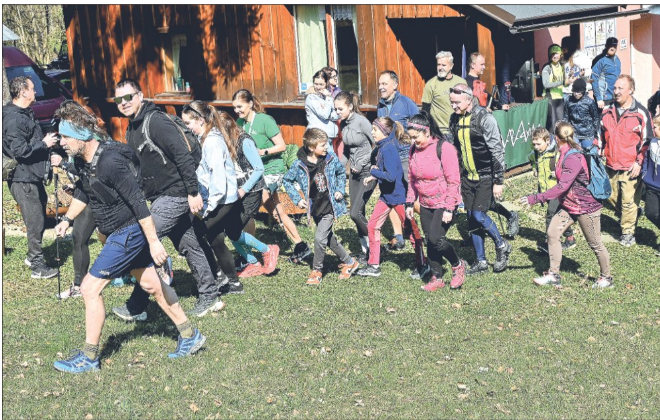
Na osm desítek sportovců se vydalo o uplynulé sobotě na Everesting 2026, tedy akci, na které bylo cílem zdolat 8 848 výškových metrů, které má nejvyšší hora světa Mount Everest. Více informací na str. 8