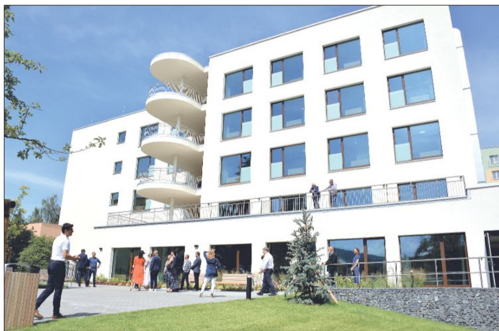
Součástí jednání zastupitelstva bude i rozhodování o dotacích v sociální oblasti. Největším příjemcem by měl být zdejší domov pro seniory.