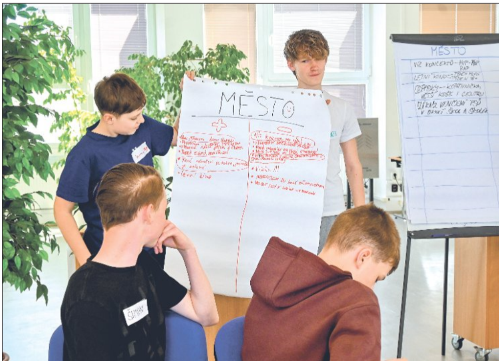
Žáci ze Základní školy Emila Zátopka se zamýšleli nad problémy, které by se z jejich pohledu měly vyřešit jak na úrovni školy, tak ve městě.

V souvislosti s podzimními komunálními volbami se probírala problematika přechodného období po volbách, příprava ustavujícího zastupitelstva i protokol o předání funkce ve vedení obcí. Zaznělo rovněž shrnutí novinek ve volebním procesu. Starostové získali i informace o stávající situaci a chystaných změnách v oblasti odpadového hospodářství a zástupci Moravskoslezského energetického centra představili služby této krajské příspěvkové organizace.