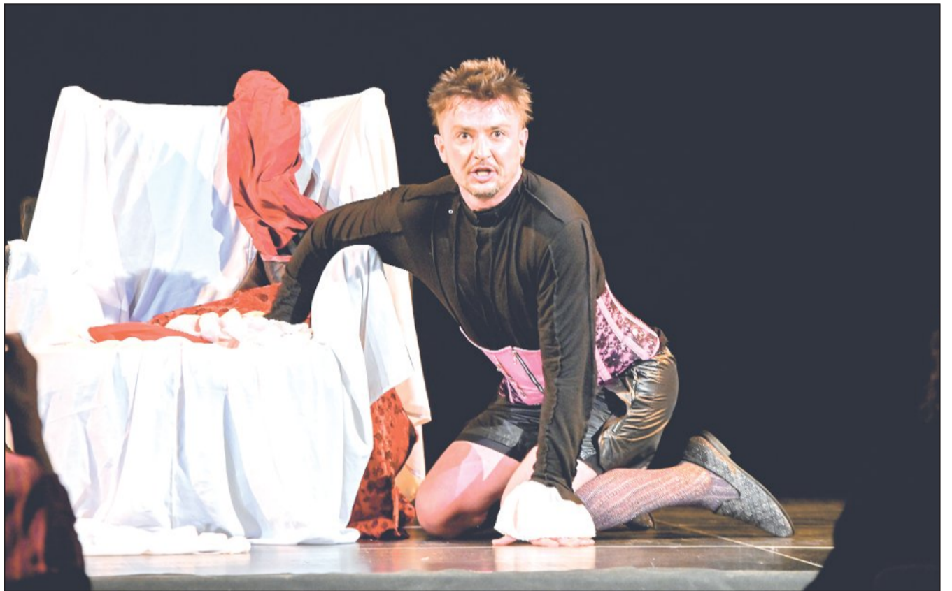
Kulturní dům o minulém víkendu hostil jubilejní 40. ročník divadelního festivalu Kopřiva. Cenu pořadatelů si z Kopřivnice odvezl polský herec Mateusz Nowak za své monodrama Pan Tadeusz. Více na straně 4.

Záměr za současných podmínek naráží na technické limity – především na šířku komunikace. Ta aktuálně měří 7,4 metru a pro šikmé nebo kolmé parkování je potřeba přibližně 4,3 až 4,8 metru a zároveň pro bezpečný průjezd musí zůstat minimálně 3,5 metru kvůli zimní údržbě, svozu odpadu i průjezdu hasičů. Navíc tato silnice je zařazena do cyklogenerelu jako jedna z vedlejších tras, a pokud by měl být zachován obousměrný provoz pro cyklisty, bylo by potřeba pro ně vyhradit další jeden a půl metru široký pás. (Pokračování na straně 2)