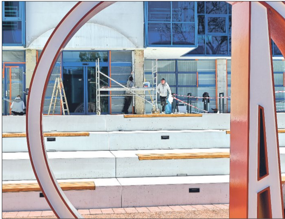
Muzeum Novojičínska nechává vizuálně upravit vchod do muzea osobních automobilů v rekonstrukci na dokončení revitalizace prostranství před budovou.