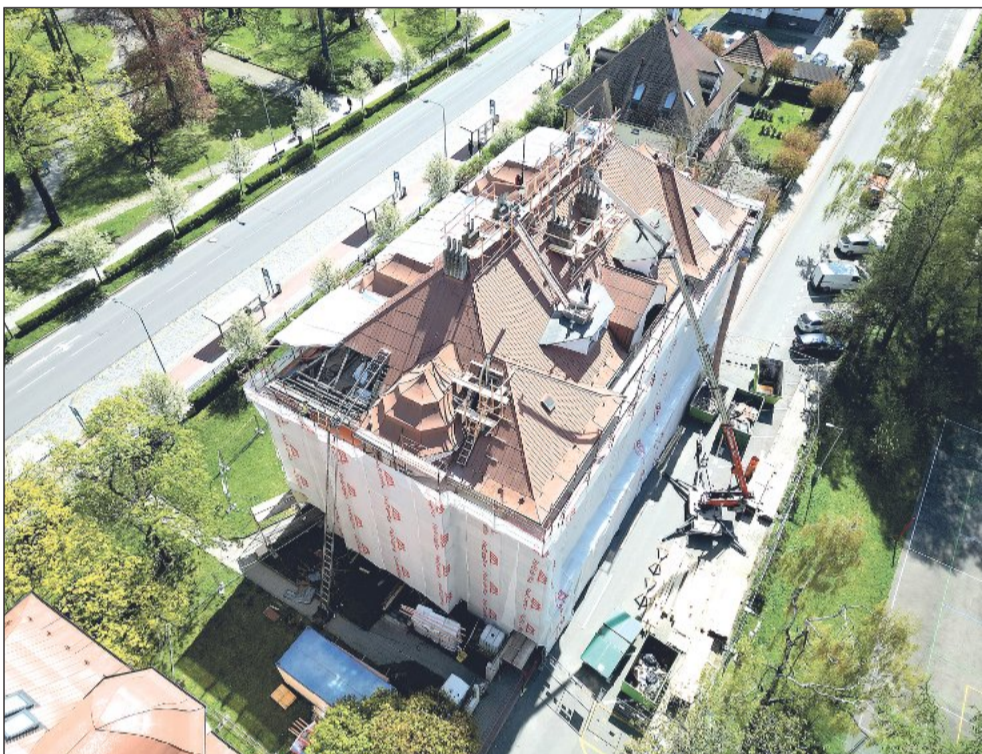
Aktuálně probíhající rekonstrukce střechy jednoho z domů na Sokolovské ulici má skončit 6. července.