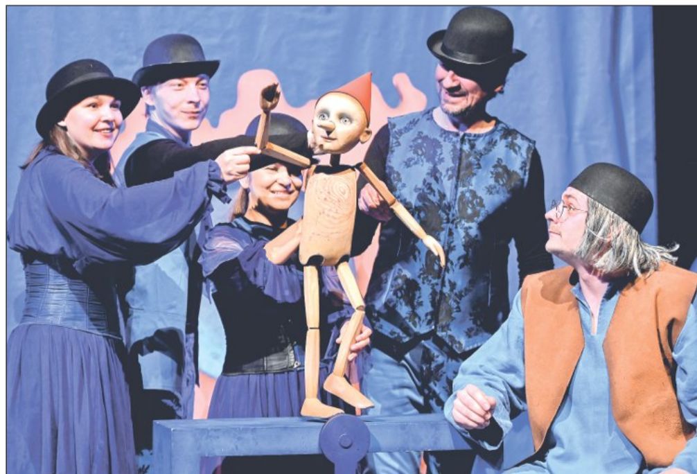
Poetická loutková adaptace Pinokia v podání Bábkového divadla Košického kraja odstartovala sobotní program přehlídky Kopřiva.