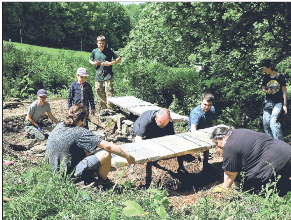
Proměna místa, kde stávala usedlost U Hurských, pokračovala minulou sobotu instalací dvojice laviček a údržbou celé lokality.

Už dříve během jara byly vyčištěny a prohloubeny tři tůně vybudované v místě v devadesátých letech. Ty postupně ztratily svou funkci, ale nyní už se znovu plní vodou a poskytují útočiště vodním živočichům. Práce na obnově usedlosti U Hurských mají pokračovat na podzim, kdy je v plánu výsadba jedenácti ovocných stromů v místech někdejšího sadu. Speciálně pro tuto výsadbu už byly na jablonožové podnože naroubovány štěpy kopřivnického kuzelku, a na místo by se tak měla vrátit stará regionální odrůda.