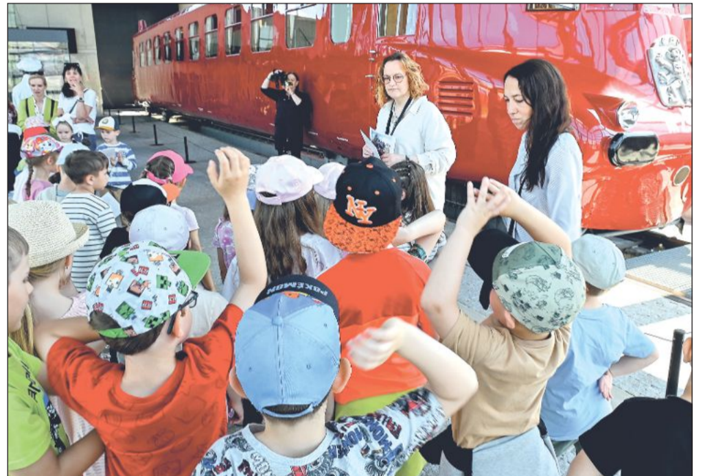
První zastávkou dětí z bánovecké školky byl depozitář Slovenské strelý. Právě „červený vláček“ je ústředním motivem přeshraniční spolupráce mateřských škol.