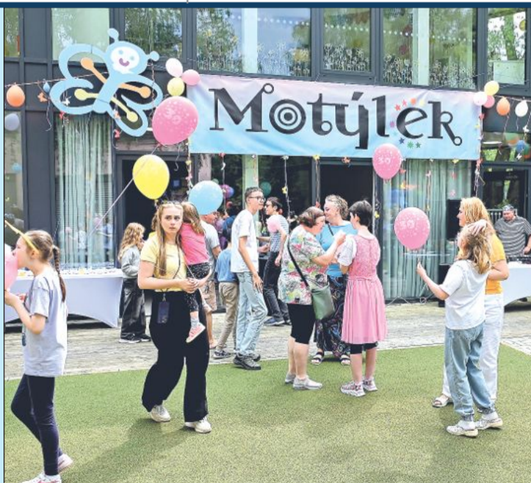
Speciální škola Motýlek slavila výročí se zaměstnanci i absolventy vydařenou zahradní party.