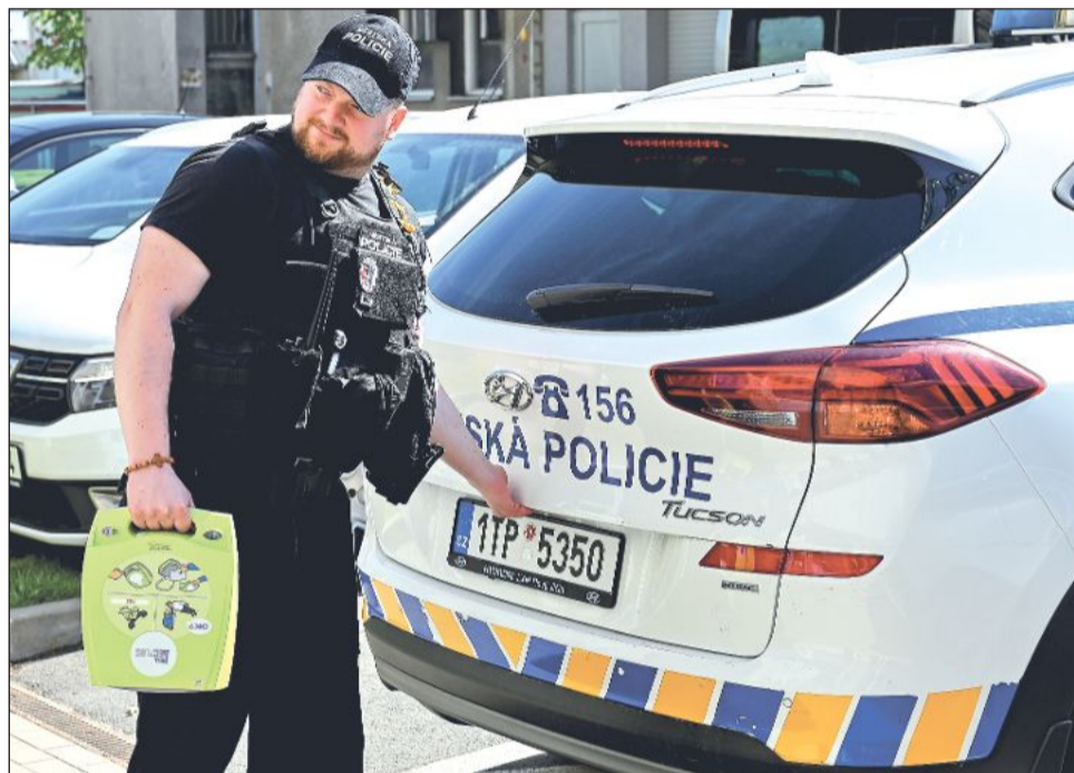
Součástí výbavy služebního vozu kopřivnické městské policie je nově i automatický externí defibrilátor.

Nová dráha podle jeho slov nebude sloužit jen k tréninku, ale také pro závody seriálu Minicup, kde si plochodrážní potěr osvojuje první závodní zkušenosti. První větší závodní víkend plánují pořadatelé bezprostředně po skončení školního roku. Kromě závodů nejmenších jezdců by se v Kopřivnici mělo uskutečnit také mistrovství republiky stopětadvacítka na krátké dráze. Víkend má být navíc ideální příležitostí pro otevření nové dráhy a její představení veřejnosti.