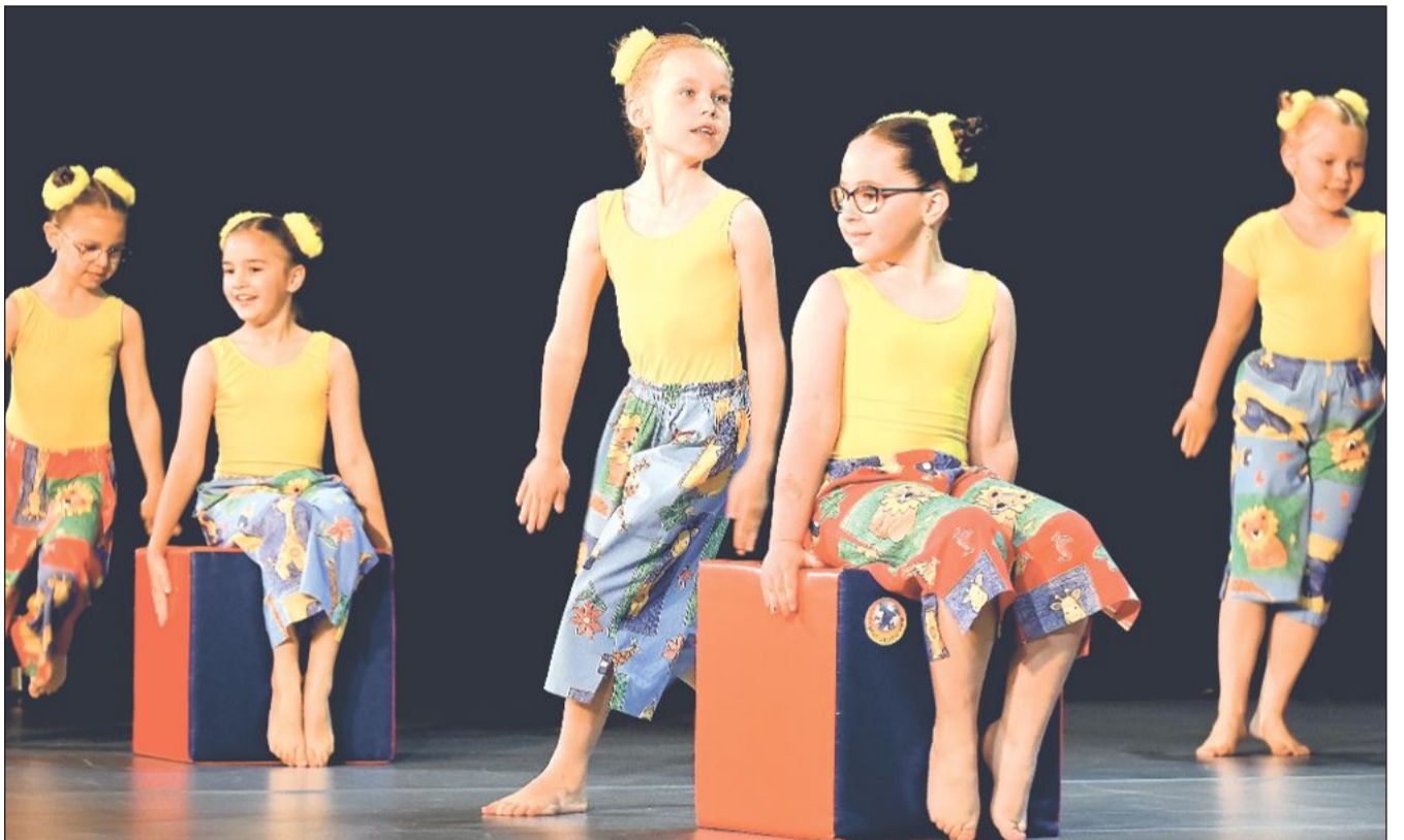
TANEČNÍ KONCERTY: Celkem sedmkrát v minulém týdnu žákyně a žáci Tanečního oboru ZUŠ Zdeňka Buriana vyprodali velký sál kulturního domu. Celkem 226 vystupujících od předškolních dětí až po dospělé studentky se podílelo na 28 choreografiích, které vznikly během 2. pololetí ve výuce i na tanečních soustředěních. Snímek je z vystoupení Smolíkoví prvního ročníku.

Výběr dodavatele stavby radní schválili. Zakázku za necelých 16 milionů korun měla realizovat společnost M-SILNICE. Firma však nakonec odmítla podepsat smlouvu. Jako důvod uvedla zhoršení mezinárodní situace související s konfliktem mezi Spojenými státy a Íránem. „Ten má přímý dopad na stabilitu dodavatelských řetězců, ceny vstupů, logistiku a celková rizika spojená s realizací plnění předmětu veřejné zakázky... nejsme schopni zajistit řádné a odpovědné plnění zakázky v rozsahu a podmínkách uvedených v nabídce, aniž by došlo k nepřiměřeným ekonomickým a provozním rizikům,“ vysvětluje svůj postup firma. Problém má být například ve výrazně vyšších cenách asfaltu i pohonných hmot. Město podle slov starosty Hanuse jednalo s vítěznou společností i dalšími uchazeči v pořadí, kromě toho, že firmy avizovaly podobné obtíže, žádaly od města garance, že vzniklý rozdíl v ceně uhradí. „To ale není možné. Firma musí podepsat smlouvu v podobě, v jaké byla vysoutěžena. Nemůžeme dopředu podepsat dodatek nebo příslib doplacení víceprací,“ uvedl Adam Hanus s tím, že jediným schůdným řešením bylo celou soutěž zrušit. Nové výběrové řízení bude moci město vyhlásit až po dokončení všech zákonných lhůt souvisejících se zrušením soutěže. (Pokračování na str. 2)