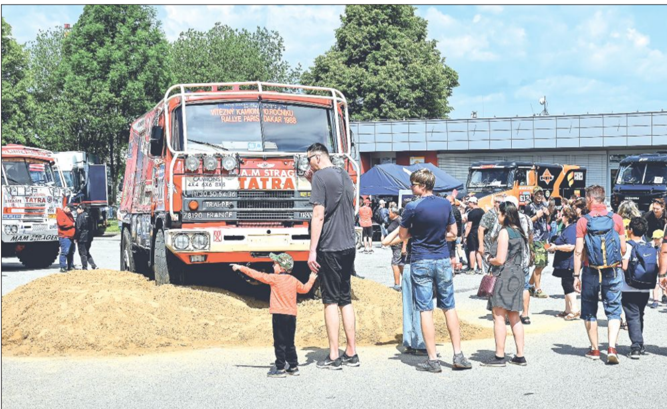
Dakarská zóna, ve které bylo možné vidět na jednom místě největší množství speciálů, které v průběhu čtyř dekád vyrážely na nejslavnější rallye světa, byla hlavním lákadlem letošních Kopřivnických dnů techniky, které během víkendu navštívilo zhruba 25 tisíc lidí.

Nová soutěž by měla vyžadovat také vyšší technický standard kol, než je tomu nyní. (Pokračování na straně 3)