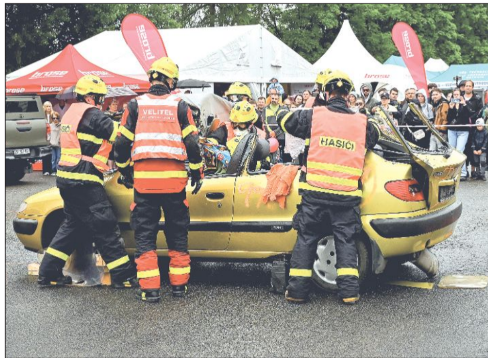
Velkému zájmu návštěvníků Dnů techniky se těšila dynamická ukáзка práce zdejší jednotky dobrovolných hasičů.

Přestože v sobotu počasí příliš nepřálo a akci několikrát zkroutil déšť, o návštěvníky nebyla nouze ani v sobotu. V neděli po návratu letního počasí pak areál doslova praskal ve švech. Pořadatelé hovoří o pětadvaceti tisících návštěvníků a v neděli byl zájem tak velký, že bylo třeba posílit i připravené kyvadlové autobusy, které vozily návštěvníky do areálu.