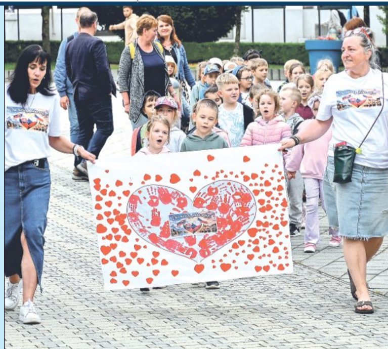
Návštěvou v Bánovcích nad Bebravou se uzavřel několikaměsíční projekt spolupráce MŠ z partnerských měst.

Slovenští hostitelé přivítali české kamarády uvítací písní a tancem. (Pokračování na str. 2)