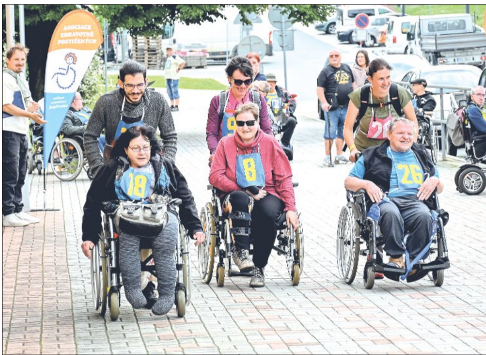
Soutěží v jízdě na invalidních vozíčkách vyvrcholily soutěže 25. ročníku Her zdravotně handicapovaných, které probíhaly ve škole dr. Milady Horákové a jejím okolí.