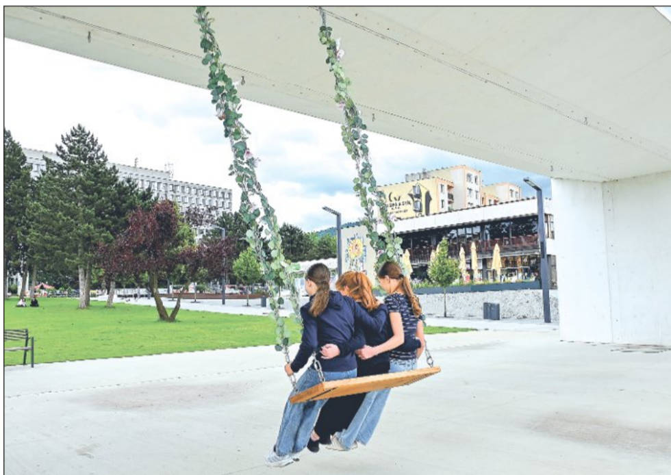
Velikonoční věnec pod Lašskou bránou vystřídala na začátku týdne nová atrakce. Houpačka bude na místě zavěšena do Bartolomějské pouli.

Město si monitoring objednálo i kvůli další plánované výstavbě poblíž někdejší staré ekologické zátěže s cílem ověřit, jak se kvalita podzemní vody v lokalitě vyvíjí. Odběry proběhly 7. května na šesti monitorovacích objektech a následně laboratorní rozbory se zaměřily na polycyklické aromatické uhlovodíky, ropné látky a široké spektrum těžkých kovů. „Výsledek je celkově příznivější než v minulosti, zároveň ale odborníci upozorňují na možný přetrvávající výskyt některých hůře rozpustných znečišťujících látek, které se mohou do okolí vyplavovat pomaleji a objevovat se se zpožděním, což má být důvodem pokračovat ve sledování lokality zhruba s tříletou periodicitou,” konstatoval místostarosta Stanislav Šimíček.