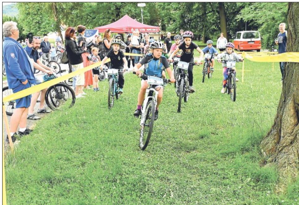
Součástí Cykloodpoledne v pátek 12. června byly i mezi dětmi oblíbené Cyklohrátky v režii CykloArt bike klubu z ASK Tatra Kopřivnice.

Další akce se pak uskuteční až po prázdninách, a to plánovaná přednáška hasičů na téma Klidné stáří v bezpečí aneb Jak chránit sebe i svůj domov.