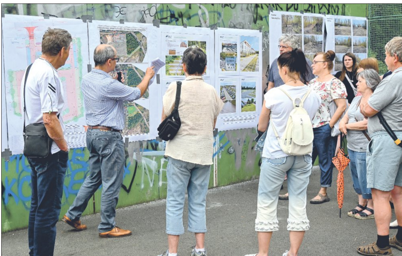
Lidé, kteří přišli na veřejné projednání Na Luhách, se mohli na místě podrobně seznámit se zpracovaným projektem odstavného parkoviště na ulici Dělnické. Hovořilo se i o záměru rekonstrukce průchodu mezi ulicemi Mírovou a hřištěm.