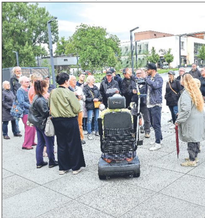
Premiérová komentovaná procházka městem přilákala minulý týden zhruba tři desítky zájemců.

být zaměřené například na geologii, flóru a faunu, také nejstarší historii Kopřivnice a její archeologické lokality. V plánu je ale například i procházka ve stopách Emila Zátópky a dalších místních rodáků.