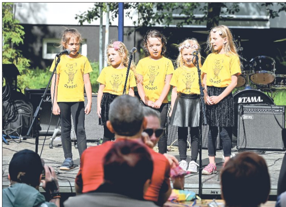
Dětský den v režii Základní umělecké školy MIS music proběhl premiérově minulou nedělí na zeleném prostranství v sousedství školy. Veřejnosti se představily soubory a sbory působící na škole. Lidé měli možnost využít dne otevřených dveří a děti si užily připravenou zábavu.